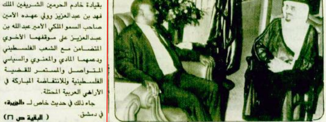
استقبل خادم الحرمين الشريفين الملك فهد بن عبد العزيز آل سعود حفظه الله في مكتبه بقصر السلام امس دولة رئيس الوزراء في جمهورية العراق السيد محمد حوادتي مدير الوفد المرافق له. وقد سلم دولة رئيس الوزراء دولة رئيس الوزراء في جمهورية العراق السيد محمد حوادتي مدير الوفد المرافق له. وقد سلم دولة رئيس الوزراء في جمهورية العراق السيد محمد حوادتي مدير الوفد المرافق له.

موقف بعض قيادات المنظمة بجانب الغزو العراقي الحق ضررا بالغا بالقضية معلق للجزيرة - محمد الجهلي أعرب السيد خالد الفاهوم رئيس المجلس الوطني الفلسطيني عن بالغ تقديره والشعب الفلسطيني للمملكة العربية السعودية بقيادة خادم الحرمين الشريفين الملك فهد بن عبد العزيز وولي عهده الأمين صاحب السمو الملكي الأمير عبد الله بن عبد العزيز على موقفهما الأخرى المتضامن مع الشعب الفلسطيني ودعمهما المادي والمعنوي والسياسي المتواصل والمستمر للقضية الفلسطينية وللانتفاضة المباركة في الأراضي العربية المحتلة. جاء ذلك في حديث خاص لـ «الجزيرة» في دمشق. (البقية ص ٢٦)