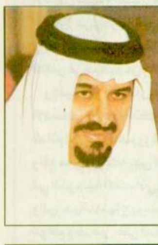
البيعة «ص 29»

اليوم بمدينة جدة سمو النائب الثاني يرحى احتفال معهد قوات الدفاع الجوي