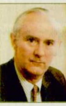
البيعة «ص 29»

كتب: محمد العديروس: وصف سفير بريطانيا الجديد لدى المملكة السيد اندرو جرين، وصف الملكة بأنها دولة هامة ولها ثقلها السياسي المميز في المنطقة. وقال السفير البريطاني ان بلاده تنظر للمملكة على انها المرتكز والقوة الاساسية في المنطقة، وترتبط معها بعلاقات وطيدة في جميع المجالات السياسية والاقتصادية والاستراتيجية. منذ عهد الملك عبدالعزيز مؤكدا ان مهمته كسفير هي تنمية هذه العلاقات وتطويرها لصالح البلدين الصديقين. وأشار السفير البريطاني في معرض رده على سؤال