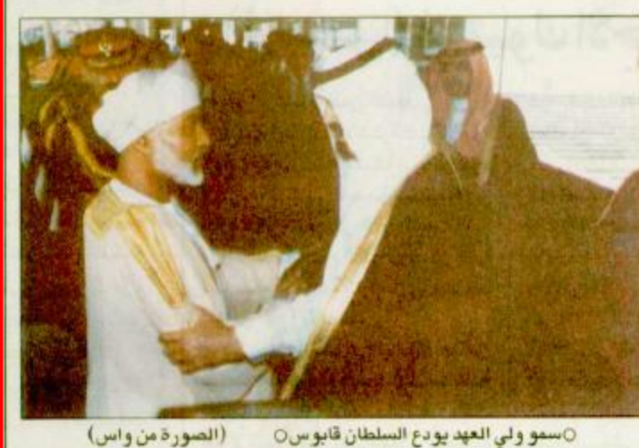
سمو ولي العهد يودع السلطان قابوس البقية «ص 29»

جدة - واس غادر جلالة السلطان قابوس بن سعيد سلطان عمان جدة أمس بعد زيارة للمملكة استغرقت عدة أيام. وكان صاحب السمو الملكي الأمير عبدالله بن عبدالعزيز ولي العهد