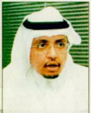
د. عبدالله بن حسين السعيد

لتسليط الضوء على مدينة الملك فهد الكشفية بمحافظة الطائف والتي تعد الأولى عربياً من حيث التجهيزات والتصميم التقني سعادة مدير التعليم بمحافظة الطائف وقائد عام المخيم الكشفي العربي الرابع والعشرين الدكتور عبدالله بن حيسون السعيد وسألناه إعطاء نبذة عن مدينة الملك فهد الكشفية بثوبها الجديد فقال تقع مدينة الملك فهد الكشفية إلى