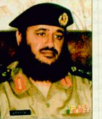
○ العقيد علي بن إبراهيم القرني

بلقرن/عبد الخالق علي القرني عبر عدد من المستولين في محافظة بلقرن عن عظيم سعادتهم وبإبالغ اعترافهم بزيارة صاحب السمو الملكي الأمير عبد الله بن عبد العزيز ولي العهد ونائب رئيس مجلس الوزراء ورئيس مجلس الأمنيات والرياسة والوقوف على سير العمل والخدمات المقدمة للمواطنين وتهدف إلى الرقي والتطور للمنطقة، وأضاف آل خبتي قائلاً أن زيارة سمو ولي العهد الأمين لمحافظة بلقرن لهي بمثابة العرس فهي لقاء الحب الكبير ولقاء الفرح ولقاء الأب بأبنائه وهذه الزيارة ليست بعربية عليه حفظه الله فقد عودتنا قيادتنا الرشيدة على مثل هذه الزيارات للوقوف على سير العمل والخدمات المقدمة للمواطنين وتهدف إلى الرقي والتطور للمنطقة... فمرحباً بك يا صاحب السمو بين أبنائك في محافظة بلقرن. ○ ومن جانبه وصف الأستاذ سعد بن صالح القرني مندوب تعليم البنات بمحافظة بلقرن المشاعر التي تجيش في قلوب الجميع بقوله: اليوم ونحن نرى محافظة بلقرن وقد ارتدت ثياب البهجة والسرور وتزينت بالسعادة والحيور، وقد أمل مكتب صاحب السمو الملكي الأمير عبد الله بن عبد العزيز ولي العهد ونائب رئيس مجلس الوزراء ورئيس مجلس الأمنيات والرياسة الوطنية المشوق الكريم عليها، فإنني أصالة عن نفسي ونياية عن كافة منسوبي مندوبية تعليم البنات بمحافظة بلقرن أتقدم بواقر التحية وعظيم التهنية والتقدير لزيارة سموه الكريم لهذه المنطقة إن تشريف صاحب السمو