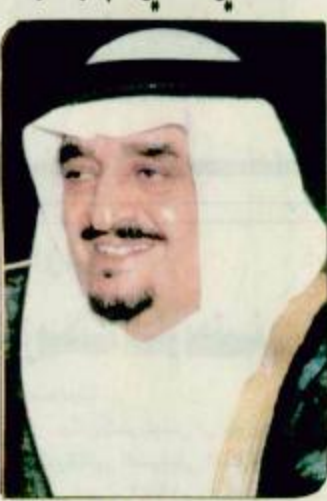
٣- ب. وعرب الملك المقدي في برقيته باسم شعب وحرمة الملكة العربية السعودية «البقية ص ٣٠»