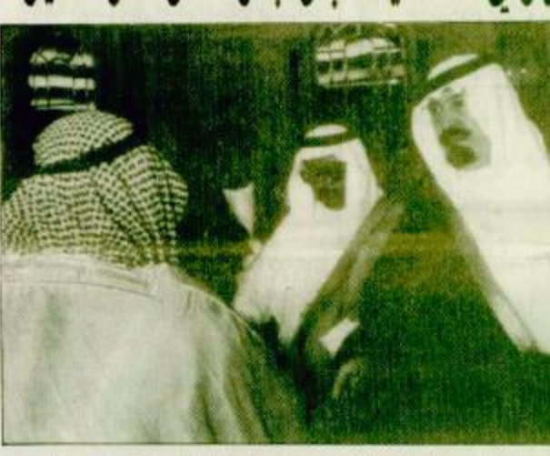
٣- ب. استقبل صاحب السمو الملكي الامير عبد الله بن عبد العزيز في العهد نائب رئيس مجلس الوزراء ورئيس الحرس الوطني في قصر سموه بجدة مساء أمس «البقية ص ٣٠»