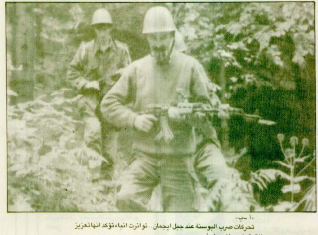
١- ب. تحركات صرب البوسنة عند جبل ايجمان. تواترت اثناء تؤكد انها تعزيز للقوة وليس انسحابا.

جددت روسيا أمس الثلاثاء معارضتها للجوء الى القوة في البوسنة والمحرك واعتبرت ان الحرب في هذه الجمهورية اليوغوسلافية السابقة بلغت مرحلة بالغة الخطورة، بعد ان وافق حلف شمال الاطلسي على شن غارات جوية على المواقع الصربية . وقال المتحدث باسم وزارة الخارجية الروسية طيبشا ل. ا. ف. ب. انه من المقرر ان يوضع وزير الخارجية اندريه كوزيريف موقف موسكو في اتصالات مع مسؤولين كبار في «البقية ص ٣٠»