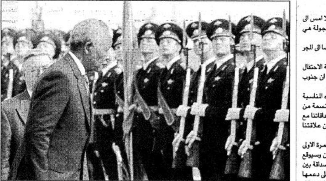
□ موسكو. الاتحاد الروسي. أ.ف.ب.

□ موسكو ١٠ أ.ف.ب: وصل الرئيس الجنوب أفريقي نلسون مانديلا أمس إلى روسيا في زيارة دولة تستمر ثلاثة أيام في إطار جولة هي الأخيرة له في الخارج قبل تفرغه لولاية رئاسية. وموسكو هي للرحلة الأولى في جولة مستوفاة أيضا إلى الجورجيا وباكستان والصين. وقبل مغادرته أكد مانديلا أمام تجمع بمناسبة الاحتفال بيوم الحرية في أومانتا (محافظة الكاب الشرقية) أن جنوب أفريقيا ستواصل بناء علاقات مع بقية دول العالم. وقال أمام نحو ٢٠ ألف شخص احتشدوا لهذه المناسبة «سأزور خلال جولتي دولاً تضم أكثر من مليار نسمة من سكان العالم ومن خلال هذه الزيارات سنخزن صداقاتنا مع دول هي شريكة في بناء عالم أفضل ونحن نسعى علاقتنا المتصاعدة مع هذه الدول لسلمتنا ومصالحنا». وسيجري مانديلا في روسيا التي يزورها للمرة الأولى محادثات خاصة مع نظيره بوريس يلتسين وسيتوقع البلدان خلال هذه الزيارة إعلاناً حول علاقات الصداقة بين البلدين، ويؤيد مانديلا أيضاً شكر موسكو على دعمها للحزب الشيوعي الوطني الأفريقي خلال نضاله ضد نظام الفصل العنصري في جنوب أفريقيا. وبعد زيارته لروسيا سيواصل مانديلا ثلاثة أيام في مكان ما في أوروبا وفي موسكو في مكتبه ويتنقل في الخامس من أيار/مايو من أيار/مايو فيباكستان في الرابع من الشهر ذاته على أن ينهي جولته في السابع منه.