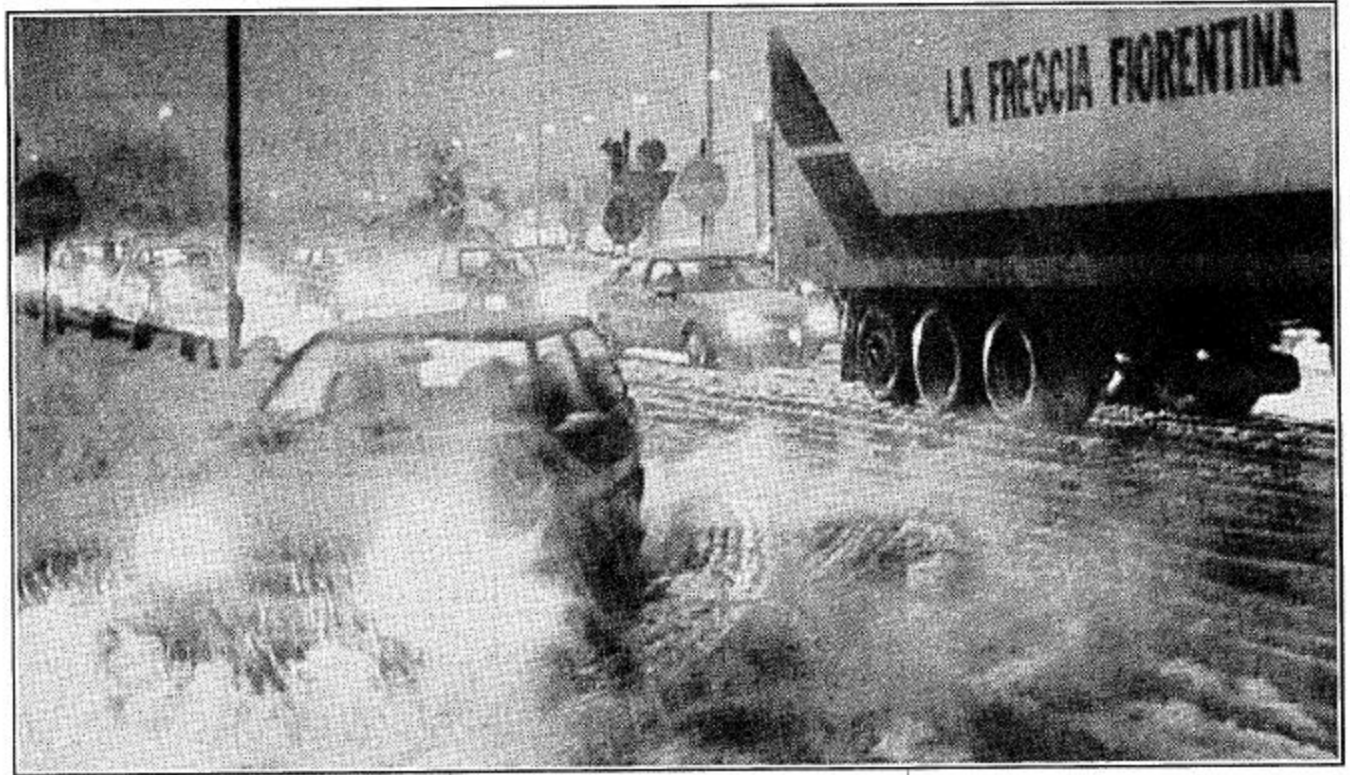
واشنطن - واس: أعلن الرئيس الأمريكي بيل كلينتون أمس الأول حالة طوارئ في ولاية بنسلفانيا التي اجتاحتها فيضانات اجبرت مئات الاف من الأمريكيين على مغادرة منازلهم على الساحل الشرقي.

وقالت تقارير اعلامية ان حوالي 4000 منزل قد اصيبت بأضرار ولقي تسعة اشخاص على الأقل مصرعهم في بنسلفانيا وولاية نيويورك المجاورة. وفي هايسبيرج عاصمة الولاية هجر حوالي 8000 شخص بينهم حاكم الولاية توم ريدج منازلهم عندما دخلتها أو هددتها مياه نهر سوسكويهانا. كذلك انهار أحد أضخم الكباري في هايسبيرج بعد دقائق من اختلاله بواسطة الشوطة من متفرجين ومارة بينما غرق العديد من الناس عن عمد بتبريد سياراتهم الفيضانات. وأعلن عمدة بتيرج مدينة بانها منطقة كوارث عندما فاضت الأنهر الثلاثة في المدينة على الضفتين.