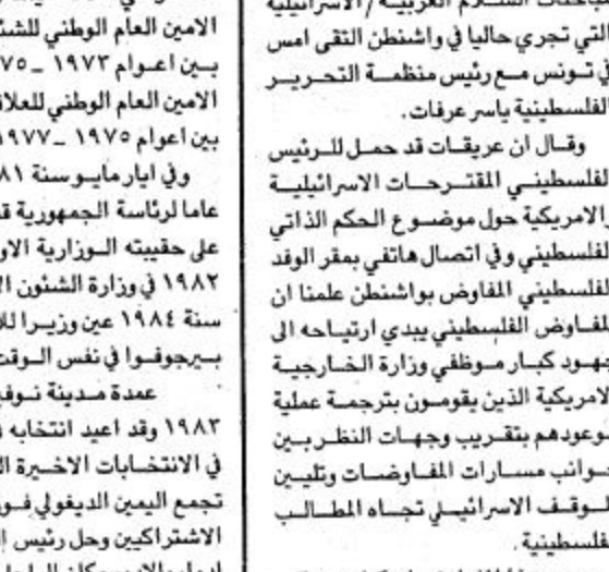
المحافظون والتي تبلغ ١٢ ألف صوت... قيل الانتخابات الفرعية...