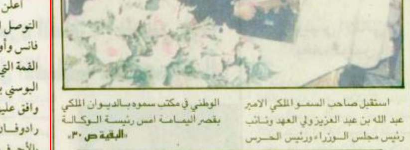
استقبل صاحب السمو الملكي الامير سلطان بن عبد العزيز نائب ولي العهد و نائب رئيس مجلس الوزراء ووزير الدفاع السيد / هروشي أوتا (واس).

استقبل رئيس مجلس الغرف الألماني صوبه واي العهد يستقبل رئيسة الوكالة الدولية للطاقة استقبل صاحب السمو الملكي الامير عبد الله بن عبد العزيز ولي العهد و نائب رئيس مجلس الوزراء ورئيس الحرس الوطني في مكتب سموه بالديوان الملكي بقصر اليمامة امس رئيسة الوكالة الدولية للطاقة «البيقة ص ٣٠»