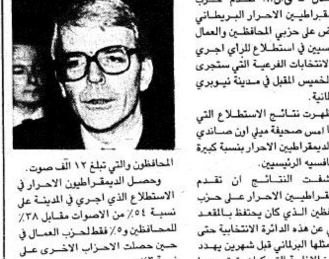
المحافظون والتي تبلغ ١٢ ألف صوت... قيل الانتخابات الفرعية...