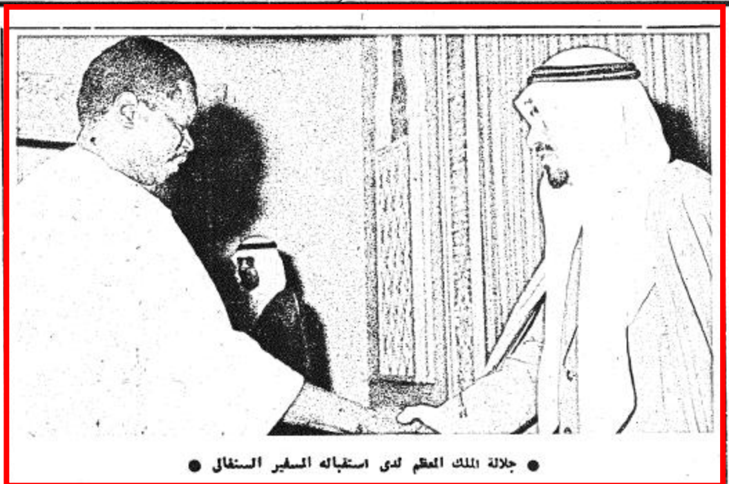
جلالة الملك العظم لدى استقباله السفير السنغالي

المملك يستقبل العلماء العزيز في قصر العكر صباح أس أصحاب الفضيلة العلماء والمتأمن وجما من المواطنين .