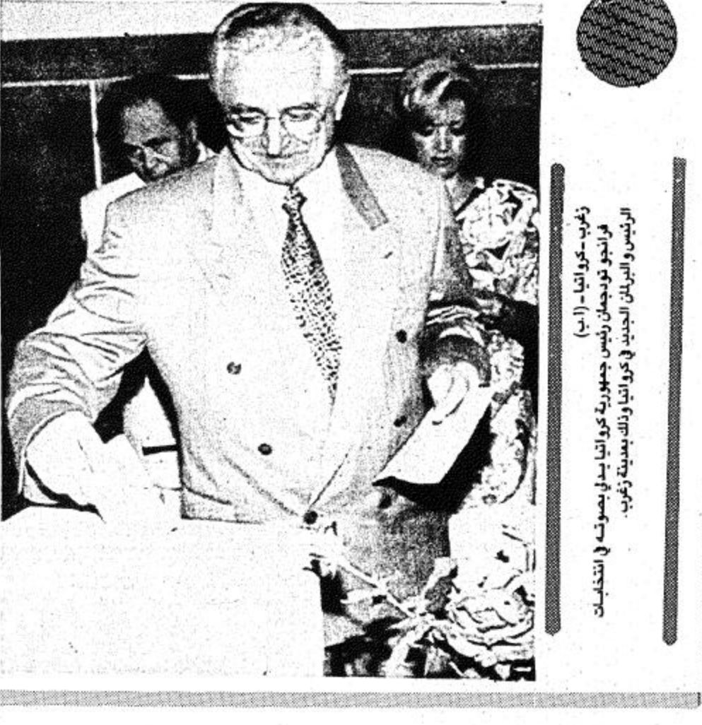
تخريب كويبرا (الرجل) في جنوب لبنان رئيس جمهورية سوريا باني بصفوف في انتخابات الرئيس والبرلمان الجديد في كويبرا وذلك بمدينة كويبرا.