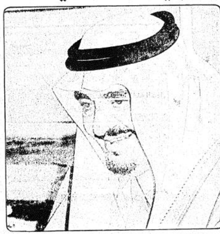
هنا سلطان بروني وتسلم اوراق اعتماد سفيري تركيا والسنگال

ما تحقق للمملكة من انجازات هائلة سينعكس اثره على دول المنطقة والعالم العربي والاسلامي انتصر الحق وتحسرت الكويت لأن وراءهم رجالا مثل خادم الحرمين الشريفين الأجيال الاسلامية القادمة ستذكر بالامتنان جهود الملك فهد لخدمة الاسلام والمسلمين