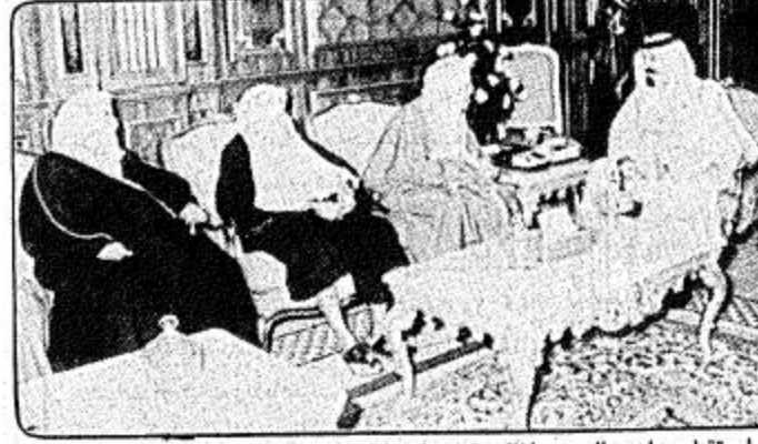
استقبل صاحب السمو الملكي الامير عبد الله بن عبد العزيز ولي العهد ونائب رئيس مجلس الوزراء ورئيس الحرس الوطني بمكتب سموه في الديوان الملكي قصر اليمامة بعد ظهر امس سماحة الشيخ عبد العزيز بن عبد الله بن باز الرئيس العام لادارات البحوث العلمية والافتاء والدعوة والارشاد واعضاء هيئة كبار العلماء.