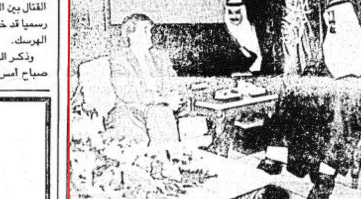
استقبل خادم الحرمين الشريفين الملك فهد بن عبد العزيز - حفظه الله - في الديوان الملكي بقصر في الديوان الملكي بقصر الرياضة أمس جموعا من المواطنين الذين اصحاب الفضيلة العلماء والمشايخ.