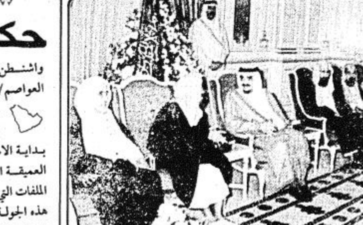
استقبل خادم الحرمين الشريفين الملك فهد بن عبد العزيز - حفظه الله - في الديوان الملكي بقصر في الديوان الملكي بقصر الرياضة أمس جموعا من المواطنين الذين اصحاب الفضيلة العلماء والمشايخ.