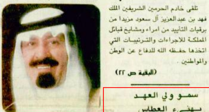
السفير السعودي في واشنطن

نيويورك / الامم المتحدة / نيويورك / الناصر / البوكمال / الجزيرة : لم يعد الخيار العسكري لاجبار العراق على الانسحاب دون شروط من الكويت مجرد تكهن، وإنما أصبح الرقم الرئيسي في معادلة الحل الدولي لتحرير الكويت واعادتها لأهلها واعادة الشرعية الكويتية اليها . فالقرار رقم ٦٧٠ القاضي بفرض الحصار الجوي على العراق ليكتسب به طوق الحصار الدولي الكامل حول العراق، وضع رئيس النظام العراقي صدام حسين أمام خيارين لا ثالث لهما . اما الانسحاب لمرحلة الدولية بالانسحاب من الكويت دون شروط او ماطلة، واما مواجهة الخيار العسكري لوقف عدوانه على الكويت وعلى الشرعية الدولية المستعمل في ميثاق الامم المتحدة والقانون الدولي . ويقول المراقبون ان رد الفعل الاولي من جانب النظام العراقي للقرار الدولي رقم ٦٧٠ (الحصار الجوي) والذي عكس تعنت الرئيس العراقي وتبنيده بتجويد