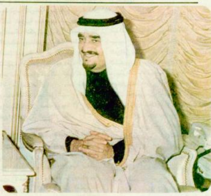
فهد بن عبد العزيز آل سعود ولي العهد يتلقى في الرياض من قبل وزير الخارجية السعودي