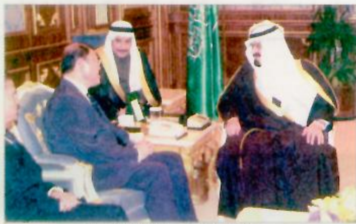
سموه لدى استقباله مدير منظمة التجارة العالمية

مع الوقت التقاهم بين الشعين.. وأجابه صاحب السمو الملكي الأمير عبدالله بن عبدالعزيز قائلاً.. «والملكة العربية السعودية ترحب بكم بكل من يحب السعودية إليها وعلى الرحب والسعة».. إثر ذلك ألقى فخامة الرئيس أرنستو زيبو رئيس جمهورية المكسيك السابق كلمة أعرب فيها عن سروره بالمشاركة في هذا الملئقي مما أعطاه الفرصة لمعرفة المملكة العربية السعودية وقال «يا صاحب السمو السابق كلمة أعرب فيها عن سروره أنها فرصة عظيمة لي أن أرى الناس هنا فخورين بما أنجز وما تحقق.. كما أنهم فخورون بتاريخهم أيضاً ويتطلعون في نفس الوقت إلى المستقبل وأعتقد أن لبلادي علاقة قوية مع المملكة العربية السعودية».. وأضاف فخامته بقوله «أود أن أشير هنا إلى أنه في عام ١٩٩٨م انخفض سعر النفط بشكل حاد مما عرض بلادي للمكسيك إلى أزمة اقتصادية وظلت من وزير النفط الحضور إلى هنا وفنزويلا للتفاوض وإصلاح الوضع وقد تحسن الوضع.. فشكر أكرم بصاحب السمو على هذه الدعوة وأجابه سمو ولي العهد قائلاً.. شكراً.. فخامة الرئيس.. والشعب المكسيكي أصدقاء واتمنى له التوفيق والنجاح.. أما مسألة البترول فأفصح أن إنتهى منها سلعة ليست خافية.. ولكن أؤكد للأصدقاء أننا لا نحب أن نضر العالم أبداً.. وفي نفس الوقت لا نحب أن يطلب منا أحد أن نضر أنفسنا.. نحب الاعتدال في الأسعار مهما كان وهذا مبدأ للملكة والمحسن السعودية لا نحب أن نضر