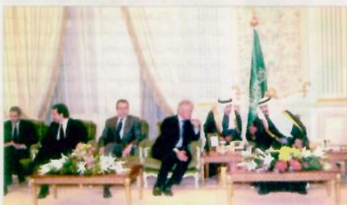
الأمير عبدالله يستقبل الأمراء والمسؤولين

العالم أبداً.. وأحب أن أخبر الأصدقاء وعلى رأسهم صديقي العزيز الرئيس كليتسون أنني يوم الأحد الفائت اقتتحت مصنعاً للغان والسوائل.. وهذا مصنع ممتاز.. وكنت أود لو كانت هناك فرصة تشاهدونه ولكن صديقي العزيز الرئيس كليتسون إذا جاء إلى هنا يكون مستعجلاً قليلاً.. ولكن الآن هذا يوم المملكة العربية السعودية الربيع ولله الحمد والعشب والخضار.. يعني الصحراء هذه الأيام من أروع ما يكون.. وشكراً.. ثم تحدثت عضو رابطة أصدقاء السعودية جون كوزاك عن سعادته بزيارة الملكة وسأل سمو ولي العهد عن مستقبل المملكة العربية السعودية وكيف سيكون مختلفاً عن ماضيها.. وأجاب سمو ولي العهد قائلاً «أول شيء إن كل بلد ماضيها حاضري.. ولا بد لكل بلد أن يتمسك بماضيه ويحسن وضعه الحاضر حسب ما تقتضيه مصلحة البلاد والشعب.. وشكراً»