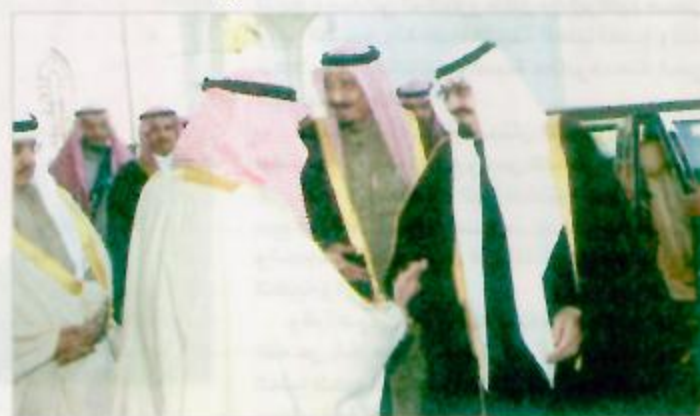
الرياض - واس:

والولايات المتحدة الأمريكية.. صداقة متينة.. صداقة مصالح.. فقد دعيت لأكون هنا وأن أحضر معي مجموعة من الأمريكين لبناء الصداقة والتفاهم بين شعبيينا الشعب السعودي والشعب الأمريكي.. وهذا الوفد معي يمثل ديانات مختلفة ويعتلون طبقات اجتماعية مختلفة ولهم اهتمام بالسلا.. ونحن نشكر سموكم على هذه الدعوة الكريمة.. وأجابه سمو ولي العهد قائلاً.. «شكراً فخامة الرئيس.. وأشكر كل أصدقاء السعودية منذ وقت الملكة السعودية وأمريكا ليست حديثة الصداقة.. أكثر من خمسة وستين عاماً صداقة منذ وقت الملكة عبدالعزيز والرئيس روزفلت ونحن في صداقة متينة واتمنى أن هذه الصداقة تدوم وإن شاء الله إنها دائمة لأن أصدقاءنا الأمريكيين الشرفاء يعرفون ما هي الصداقة التي بين المملكة العربية السعودية