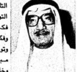
Portrait of a man, likely a high-ranking official.

جهود موفقة آتت ثمارها؟ - نعم... المخدرات وان كانت دخلت اليها لكنها لم تصل الى الشكل الخطير الملقق بحمد الله وهذا مقارنة بالدول الاخرى فندرى ان امريكا قد خصصت مؤخرا بلايين الدولارات في حملة لمكافحة المخدرات وهناك دول اخرى كذلك من هنا نحمد الله اننا لم نصل الى ما وصلوا اليه من انتشار كبير للمخدرات ونسأل الله الا تكون المخدرات سببا في