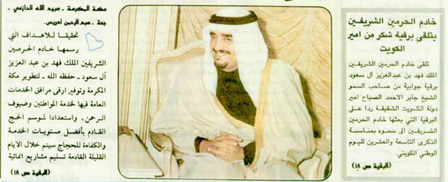
تلقى خادم الحرمين الشريفين الملك فهد بن عبدالعزيز آل سعود برقية جوائية من صاحب السمو الشيخ جابر الاحمد الصباح امير دولة الكويت الشقيقة ردا على البرقية التي بعثها خادم الحرمين الشريفين الى سموه بمناسبة الذكرى التاسعة والعشرين لليوم الوطني الكويتي. (القبضة ص ١٨)

اتصالات الغربية تشكل لجنة الحج الرئيسية لتسيير العدوة بين مرافق خدماتها لاجماع مكة المكرمة - عبده الله الماضي - حة - عبدالرحمن ادريس.