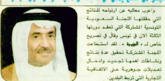
تبادل بين البلدين بدون قيود وبدون رسوم جمركية مشيرا الى ان الاتفاقية هناك عددا كبيرا من السلع يمكن ان (القبضة ص ١٨)

ابا الخليل لـ الجزيرة ، أكسير من الطع يمكن ان تصال مع تونس دون قيود