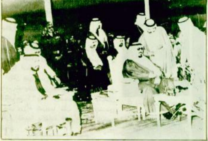
مجلس الوزراء ووزير الدفاع والمطيران والمفتش العام ورئيس مجلس ادارة الهيئة الوطنية لحماية الحياة الفطرية وامثالها، استعرض مراحل انشاء الهيئة. وقال سمو ان فكرة حياة الحياة الفطرية بدأت منذ ايام الملك عبدالعزيز واستمرت في ايام الملك سعود والملك فيصل والملك خالد برحمه الله حيث كان هدفهم دائما المحافظة على الثروة الوطنية.

إطلاق مجموعة كبيرة من الحيوانات النادرة في البيئة الطبيعية بعد اكتمالها