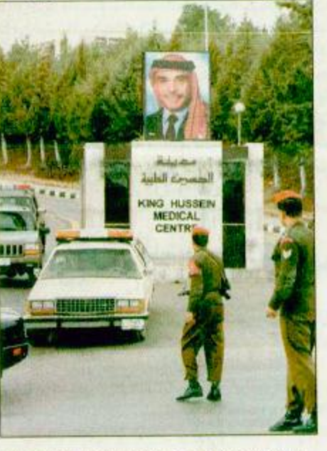
رجال بشرطة يقومون بحراسة أفراد العائلة الملكية الأردنية أثناء مغادرتهم مدينة الحسين الطبية التي يتلقى فيها الملك الحسين العلاج. وعلاؤها فرئيسية مجلة بلساوا. ا. ب. ب. البقية، ص ٣٣.

إسرائيل قتلت ٢٨ فلسطينياً.. واعتقلت ٨٣ آخرين الشهر الماضي □ واشنطن - القدس المحتلة - غزة - فونكفور، الوكالات. اعلن امس ان الرئيس الأمريكي بيل كلينتون جند خلال لثقائه بالونيس الفلسطينيين ياسر عرفات في واشنطن معارضة الولايات المتحدة اعلان قيام دولة فلسطينية في الرابع من مايو المقبل.