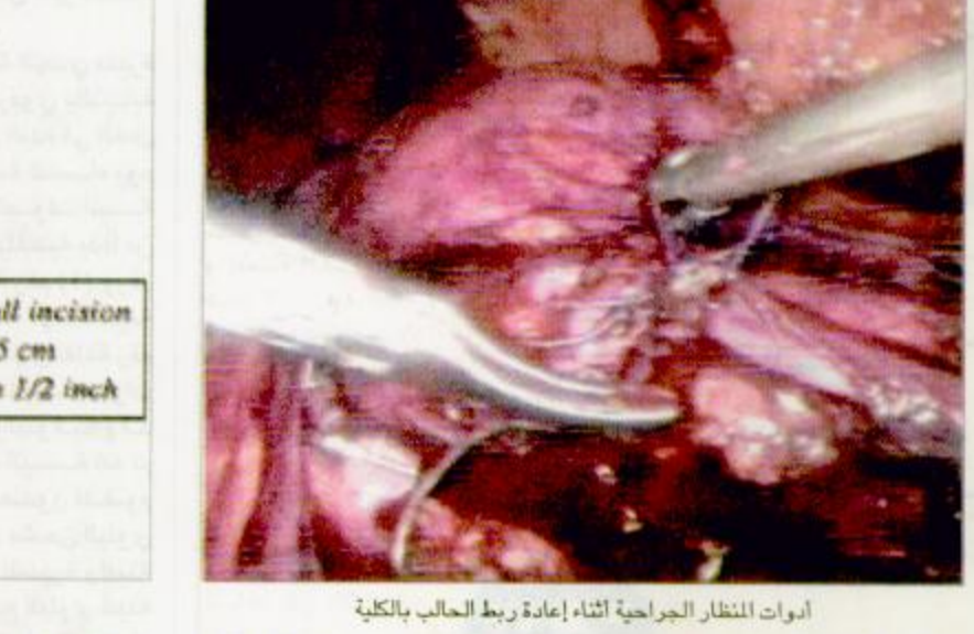
أدوات المنظار الجراحية أثناء إعادة ربط الحالب بالكلية