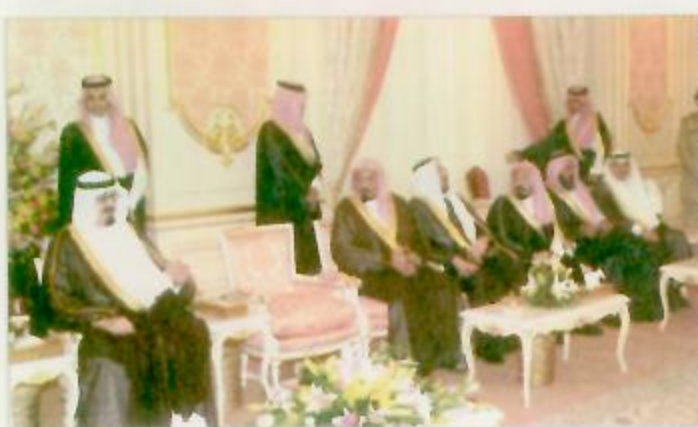
سمو ولي العهد يستقبل جموعاً من المواطنين وأعضاء مجلس غرف جدة