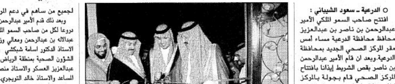
○ الأمير عبد الرحمن بن ناصر يفتتح المقر الجديد للمركز الصحي بالدرعية

لجميع من ساهم في دعم المركز. وبعد ذلك قدم الأمير عبدالرحمن بن ناصر درعاً لكل من صاحب السمو الملكي الأمير عبدالله بن عبدالعزيز ومعالي وزير الصحة الأستاذ الدكتور أسامة شبيكي ومدير عام الشؤون الصحية بمنطقة الرياض الدكتور عبدالعزيز العسكرو الأستاذة المنصور محمد المسعد والأستاذ خالد التوجيهي، والأستاذ عبدالله سعد النصار والأستاذ عبدالعزيز لغيل والأستاذ بهاء الدين موسى، وفي ختام الحفل ألقى صاحب السمو الملكي الأمير عبدالرحمن بن ناصر بن عبدالعزيز كلمة استهلها بالشكر للأئمة لأمير عبدالله والدكتور العسكرو وأعضاء اللجنة على جهودهم اللصيقة حول العمل النوب للعمل على راحة المواطنين سواء من تغذوا واصدقاء الصحة وكشف سموه عن تغذوا بأنه سوف يكون بمثابة لله في للبلدية الكفيلة بإنشاء مستشفى، وهذه بشرى لأهالي الدرعية وكونه لك مركز صحي.