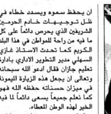
○ الأمير محمد بن تركي السديري

○ جازان - مهدي جمعي: يصل بحفظ الله ورعاعته صاحب السمو الملكي الأمير عبدالله بن عبدالعزيز ولي العهد نائب رئيس مجلس الوزراء ورئيس الحرس الوطني إلى مطار جازان الاقليمي بعد ظهر هذا اليوم الاثنين 7/5/1421هـ في زيارة للمنطقة للاطلاع على أحوالها. وسيكون في مقدمة مستقبل سموه حفظه الله معالي أمير منطقة جازان الامير محمد بن تركي السديري ومسؤولو الإدارات الحكومية ومشايخ ومواطنو قبائل منطقة جازان.