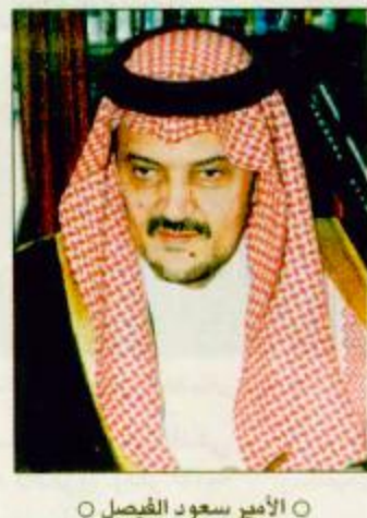
○ الأمير سعود الفيصل

○ نيويورك-واس: اجتمع صاحب السمو الملكي الأمير سعود الفيصل وزير الخارجية في نيويورك أمس الأول الأربعاء مع معالي وزيرة الخارجية الأمريكية مادلين أولبرايت. وحضر الاجتماع صاحب السمو الملكي الأمير بندر بن سلطان بن عبدالعزيز سفير خادم الحرمين الشريفين لدى الولايات المتحدة وكبير وزارة الخارجية للشؤون الاقتصادية يوسف السعدون والمستشار بسفارة خادم الحرمين الشريفين في واشنطن رحاب مسعود. كما حضره من الجانب الأمريكي نيد وكو مساعد وزيرة الخارجية الأمريكية لشؤون الشرق الأدنى ودينيش روس المنسق الأمريكي لعملية السلام وريتش فاوولر السفير الأمريكي لدى المملكة. وتم خلال الاجتماع بحث القضايا الإقليمية والدولية ذات الاهتمام المشترك ومتابعة تطورات عملية السلام في الشرق الأوسط والوضع في القرن الأفريقي والاصلاحات المطروحة لتفعيل دور منظمة الأمم المتحدة على الصعيد الدولي. وحضر الجانبان حفل الغداء الذي أقامته وزيرة الخارجية البقية «ص ٣٣»