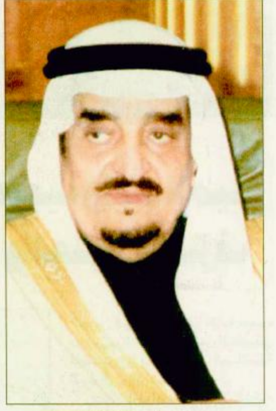
○ خادم الحرمين الشريفين

○ جدة-واس: بعث خادم الحرمين الشريفين الملك فهد بن عبدالعزيز آل سعود برقية شكر جارية لآخيه صاحب السمو الشيخ حمد بن خليفة أمير دولة البحرين فيما يلي نصها: صاحب السمو الآخ العزيز الشيخ حمد بن عيسى آل خليفة أمير دولة البحرين - حفظه الله - السلام عليكم ورحمة الله وبركاته وبعد، فقد تلقينا برقية سموكم بمناسبة مغادرتكم لبلدكم الثاني المملكة العربية السعودية وإننا إذ نقدر لسموكم مشاعركم الاخوية الصادقة لنؤكد لكم سرورنا البالغ للفاكم في بلدكم وبين اهلكم وأخوانكم وأن زيارتكم تجسد لعلم الروابط التاريخية والمحبة الثابتة بين بلدينا الشقيقين وسعيهما الدائم لتعزيزهما وما لقيتموه في بلدكم الثاني ما هو إلا واجب من اخوة يتكفون لكم كل محبة وتقدير متمنين لسمو الآخ الكريم دوام الصحة والسعادة ولشعب البحرين الشقيق استمرار التقدم والرخاء في ظل قيادتكم الحكيمة والله يبرعاكم أخوكم خادم الحرمين الشريفين الملك فهد بن عبدالعزيز آل سعود ملك المملكة العربية السعودية وكان خادم الحرمين الشريفين الملك فهد بن عبدالعزيز آل سعود قد تلقى برقية من أخيه صاحب السمو الشيخ حمد بن عيسى آل خليفة أمير دولة البحرين لدى مغادرته المملكة فيما يلي نصها: خادم الحرمين الشريفين الآخ