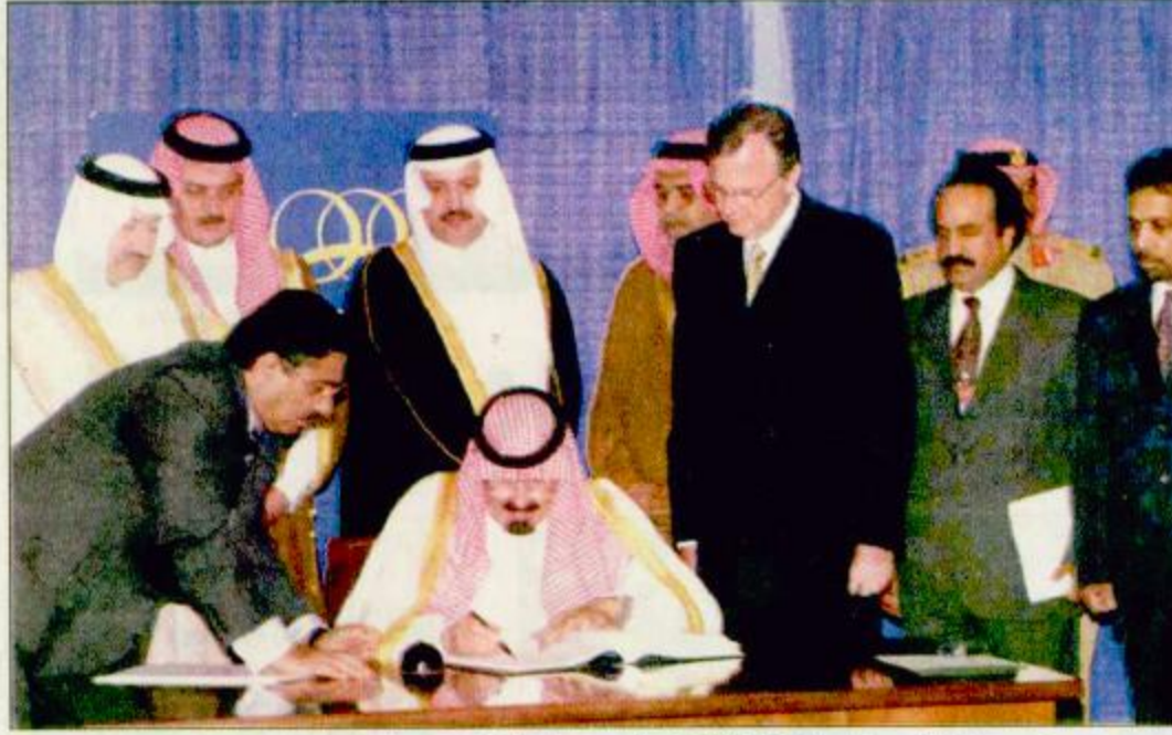
○ سمو ولي العهد يوقع على اتفاقية القضاء على جميع أشكال التمييز ضد المرأة - واس ○

○ نيويورك- رئيس التحرير-واس: تميز اليوم الثاني لأعمال قمة الألفية الثالثة بنشاط مكثف لقادة الدول المشاركين في القمة، وقد حفل برنامج عمل صاحب السمو الملكي الأمير عبدالله بن عبدالعزيز ولي العهد ونائب رئيس مجلس الوزراء ورئيس الحرس الوطني بنشاط مكثف بالإضافة إلى مشاركته في أعمال المائدة المستديرة وقمة مجلس الأمن الدولي التي عقدت في مقر الأمم المتحدة في نيويورك، قام صاحب السمو الملكي الأمير عبدالله بن عبدالعزيز ولي العهد ونائب رئيس مجلس الوزراء ورئيس الحرس الوطني ضمن حضوره قمة الألفية للأمم المتحدة المعقودة حالياً بمقر الأمم المتحدة في نيويورك قام صباح أمس الخميس بالتوقيع والتصديق باسم المملكة العربية السعودية على اتفاقية القضاء على جميع أشكال التمييز ضد المرأة والتي اعتمدها الجمعية العامة للأمم المتحدة بقرارها رقم 180/34 بتاريخ 18 ديسمبر 1989م وذلك في قسم المعاهدات بمبنى الأمم المتحدة بنيويورك. كما سلم صاحب السمو الملكي الأمير عبدالله بن عبدالعزيز مساعد الأمين العام للأمم المتحدة للشؤون القانونية ماس كوربيل وثيقة موافقة المملكة العربية السعودية على انضمامها إلى اتفاقية روتردام بشأن تطبيق إجراءات الموافقة المسبقة على استخدام أي مواد كيميائية أو مبيدات خضرة متداولة في التجارة الدولية. وقد أولت وسائل الإعلام العربية والعالية اهتماماً خاصاً بكلمة المملكة في قمة الألفية للأمم المتحدة التي ألقاها يوم أمس نيابة عن خادم الحرمين الشريفين الملك فهد بن عبدالعزيز صاحب السمو الملكي الأمير عبدالله