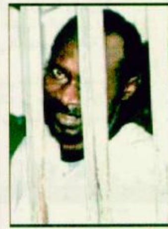
○ سفاح صنعاء

○ صنعاء-واس: أكد وزير الداخلية اليمني اللواء حسين عرب وجود مؤشرات إيجابية على صعيد التحقيقات التي تقوم بها الأجهزة الأمنية فيما يتعلق ببعض الجوانب المتصلة بجريمة كلية الطب بجامعة صنعاء مشيراً إلى ان القضية حالياً من اختصاص النيابة والقضاء وكشفت في تصريحات صحفية ان أربعة ضباط يجري التحقيق معهم حالياً في إطار القضية وإذا ثبت ارتباطهم فسيفقدون إلى النيابة. ونفى ما تردد في بعض الصحف حول تولي بعض الجهات غير الأجهزة الأمنية والنيابة التحقيق في تلك القضية. وأوضح ان تغييرات كبيرة ستتم قبل نهاية العام الجاري في صفوف أجهزة