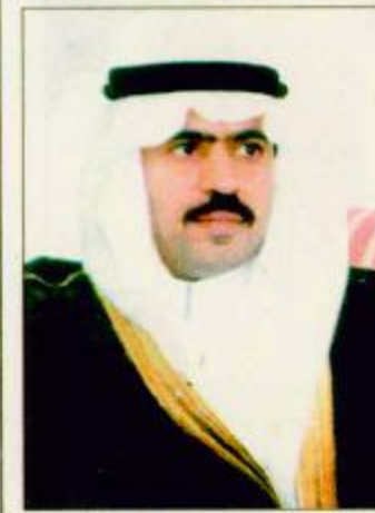
○ أحمد سالم

○ تونس-واس: افتتح الأمين العام لمجلس وزراء الداخلية العرب الدكتور أحمد السلام بتونس أعمال الاجتماع التنسيقي السنوي الخامس عشر لأجهزة الجلس الذي يهدف إلى مناقشة السبل الكفيلة بتحقيق أقصى قدر من التعاون والتنسيق بين تلك الأجهزة مما يساعد على تعزيز مسيرة العمل العربي المشترك. ومن بين الموضوعات المطروحة على جدول أعمال الاجتماع دراسة شاملة لنظام اتصالات عصرية بين أجهزة المجلس إلى جانب القضايا الفورية التي في الدورة المقبلة للمنظمة الدولية للشرطة الجنائية (الانتربول) التي ستعقد في نهاية شهر أكتوبر المقبل وذلك بهدف توحيد وجهات النظر العربية حيال تلك القضايا والخروج بموقف عربي واحد يحقق الصلحة العربية العليا. وتشتمل أجهزة مجلس وزراء الداخلية العرب إضافة إلى الأمانة العامة ومكاتبها المتخصصة على كسل من أكاديمية نايف العربية للعلوم الأمنية والاتحاد الرياضي العربي للشرطة وشعب اتصال المجلس الموجودة في وزارات الداخلية بالدول العربية المختلفة.