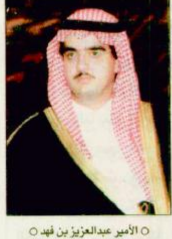
○ الأمير عبدالعزيز بن فهد

○ بودابست «المجر»- الجزيرة: تحت رعاية صاحب السمو الملكي الأمير عبدالعزيز بن فهد بن عبدالعزيز آل سعود وزير الدولة عضو مجلس الوزراء، رئيس ديوان رئاسة مجلس الوزراء يفتتح اليوم الجمعة العاشر من شهر جمادى الآخرة الجاري 1421هـ الموافق الثامن من شهر سبتمبر 2000م ملتقى خادم الحرمين الشريفين الإسلامي الثقافي، الذي تنظمه وزارة الشؤون الإسلامية والأوقاف والدعوة والإرشاد في بودابست بالمجر تحت عنوان «الجمعيات والمؤسسات الإسلامية في أوروبا ونظمها، أهدافها، آثارها»، ويستمر عدة أيام بحضور عدد من أصحاب القضاة والمعالين وكبار الشخصيات الإسلامية في مختلف أنحاء العالم، ورؤساء الجمعيات والمراكز الإسلامية في أوروبا. ويهدف المناسبة صرح معالي وزير الشؤون الإسلامية والأوقاف والدعوة والإرشاد الشريف العام على الملتقى الشيخ صالح بن عبدالعزيز بن محمد آل الشيخ أنه - يتوفيق من الله تعالى - وجه خادم الحرمين الشريفين الملك فهد بن عبدالعزيز آل سعود - حفظه الله - بإقامة هذا الملتقى الهام في المجر الذي يعد البقية «ص ٣٧»