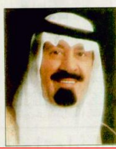
الرياض: واس صرح معالي الدكتور عبدالله بن عبدالعزيز بن معمر وزير الزراعة والمياه رئيس مجلس إدارة المؤسسة العامة لصوامع الغلال ومطاحن الدقيق بأن الدولة بقيادة خادم الحرمين الشريفين الملك فهد بن عبدالعزيز آل سعود وسمو ولي عهده الأمين حفظهما الله تولي جل عنايتها لابنائها المواطنين وتحرص على توفير سبل العيش الكريم لهم. وقال في هذا الصدد ان توفير الشعير لربي الماشية بكميات كافية واسعار ميسرة يأتي ضمن اهتمامات الدولة متحملة بذلك تكاليف استيراده حسب الاسعار المتداولة في السوق العالمية ومتابعة اعمال الشحن ومواعيد الوصول الى موانئ المملكة وما يصاحب ذلك من أعمال التفريغ من البواخر والتحميل والنقل ثم تعبئة الشعير وتوزيعه في جميع مناطق المملكة العربية السعودية.

الرياض: واس تلقى خادم الحرمين الشريفين الملك فهد ابن عبدالعزيز آل سعود حفظه الله رسالة من أخيه فخامة الرئيس محمد حسني مبارك رئيس جمهورية مصر العربية. وقام بتقل الرسالة لخادم الحرمين الشريفين معالي وزير خارجية جمهورية مصر العربية عمرو موسى خلال استقباله ايده الله له والوفد المرافق له في مكتبه بالقيّة ص ٣١.