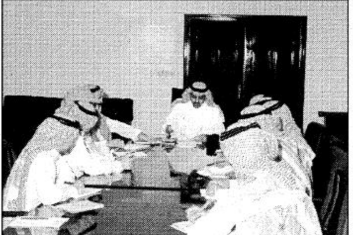
○ لقطة من الاجتماع ○

بفعالية في فعاليات هذا العام وهي حديقة الغرفة التجارية وحديقة الحيوانات وحديقة النصورة وحديقة السويدي وستكون فترة انطلاق الفعاليات فيها من الساعة الواحدة ظهراً إلى التاسعة مساءً من خلال برنامج حافل ومسابقات ومشاهد تعليمية. كما ستستعد الميادين لهذه المناسبة وسيكون أول هذه الميادين ميدان قصر الحكم حيث سيشهد مشاركة بعض السفارات لدى الملكة في المشاركة بهذه المناسبة من خلال مسيرة الجاليات وإقامة العرضة النجدية والأمسيات الشعرية كذلك سيكون الموقع الآخر والواقع بين مخرج 10 و 11 وسيشهد نفس الفعاليات والقرعات. وستستعد هذه السنة فقرة عرض الطيران الشراعي وسيكون التحليق غالباً على الحدائق ومواقع وميادين الاحتفالات وهذه في الإضافات الجديدة لهذا العام كما ستشارك بعض المراكز التجارية ومنها شركة الغنائق وبعض مدن الألعاب وستكون هناك مشاركة فاعلة لركوز الألعاب سلمان الاجتماعي وعرض مسرحية للأطفال بقصر الثقافة للأطفال والنساء ستعرض على مدى ثلاثة أيام بمعدل عرضين كل يوم وسيكون للثقافة والأدب نصيب من خلال عقد