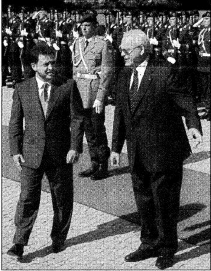
الملك الأردني الحسين بن عبد الله الثاني مع وزير الخارجية الألماني غيتراس في برلين.

عمان - ا. ف. ب. : بدأ المعامل الأردني عبد الله الثاني امس الاثنين جولته الاولى في الدول الغربية منذ اعتزل عرش بلاده في السبعين من شباط / فبراير الماضي، وذلك في مسعى لحشد الدعم الاقتصادي والسياسي لمملكته . وقال عبد الله الثاني في برلين ان الأردن بحاجة الى دعم دولي لمواجهة التحديات الاقتصادية والسياسية التي تواجهها المملكة . وقال عبد الله الثاني في برلين ان الأردن بحاجة الى دعم دولي لمواجهة التحديات الاقتصادية والسياسية التي تواجهها المملكة . وقال عبد الله الثاني في برلين ان الأردن بحاجة الى دعم دولي لمواجهة التحديات الاقتصادية والسياسية التي تواجهها المملكة .