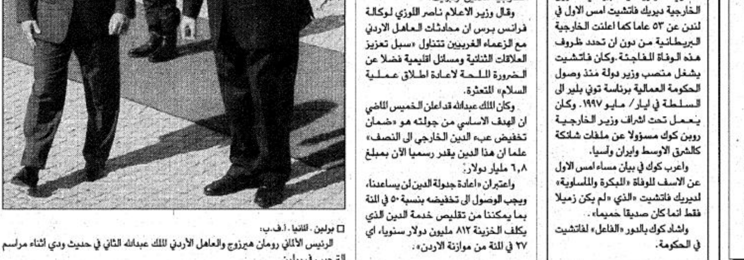
الملك الاردني عبدالله الثاني مع وفد من الوزراء العرب في عمان.

عمان ا.ف. ب. بدأ المعامل الاردني عبدالله الثاني امس الاثنين جولته الاولى في الدول الغربية منذ اعتل عرش بلاده في السابع من شباط/ فبراير الماضي، وذلك في مسعى لحشد الدعم الاقتصادي والسياسي لمملكته. ويحسب مصاصر رسمية، قام الملك عبدالله الثاني امس بتوقيع زيارة عمل الى ألمانيا حيث أجرى محادثات في برلين مع الرئيس ورومان هيرتزوغ وفي بون مع المستشار غيرهارد شرودر، وذلك قبل ان يتوجه الى لندن لاجراء محادثات يوم الثلاثاء مع رئيس الوزراء البريطاني توني بليزر. ومن المقرر وصول المعامل الاردني الى تورنا في كندا بعد غر الخميس على ان يتأخر يوم الجمعة متوجهاً الى واشنطن. وأوضح الصغر نفسه ان محادثات الملك عبدالله مع الرئيس الأمريكي بيل كلينتون المقررة في 18/ مايو مستحقة لقيامه مع كبار المسؤولين الأمريكيين ولا سيما مع وزيرة الخارجية هيلين اولبرايت. وقال وزير الاعلام ناصر لوكالة فرانس برس ان محادثات المعامل الاردني مع الزعماء الغربيين تتناول «سبل تعزيز العلاقات الثنائية ومسائل اقليمية فضلاً عن الضرورة الملحة لاعادة اطلاق عملية السلام» المتعثرة. وكان الملك عبدالله قد اعلن الخميس الماضي ان الهدف الاساسي من جولته هو «صمان تخفيض عبء الدين الخارجي الى النصف» عما ان هذا الدين يقدر رسمياً الآن بمبلغ 2.8 مليار دولار. واستمر ان إعادة جولة الدين ان يساعدها، ويجب الوصول الى تخفيضه بنسبة 50 في المئة بما يمكننا من تقليص خدمة الدين الذي يكلف الخزينة 812 مليون دولار سنوياً، اي 77 في المئة من موازنة الاردن.