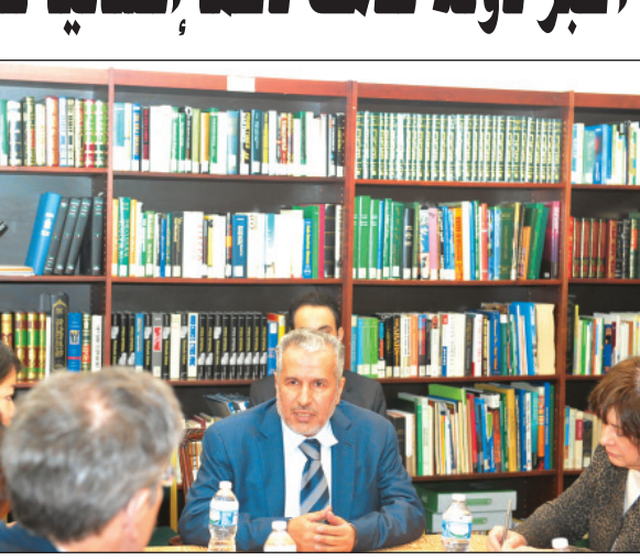
د. الربيعية متحدتاً إلى الصحفيين

صحية أو غذائية أو الاستفادة من خبراتهم في مجال البحوث الإنسانية، لذلك فالمؤسسة والمركز مقبلان على مرحلة تعاون جيدة لكلا الجانبين". وفيما يتعلق بجهود مركز الملك سلمان للإغاثة والأعمال الإنسانية لإغاثة الشعب اليمني، أوضح معالي الدكتور الربيعية أن الملكة العربية السعودية ممثلة في مركز الملك سلمان تعد أكبر دولة قدمت عملاً إنسانياً للشعب اليمني في العام ٢٠١٥م وما تزال تقدم أعمالاً إغاثية وإنسانية للشعب اليمني في العام ٢٠١٦م، مشيراً إلى أن هذه الجهود عمت جميع مدن ومحافظات اليمن وبصرف النظر عن يقطن في تلك المدن أو المحافظات. وقال المستشار في الديوان الملكي والمشرف العام على مركز الملك سلمان للإغاثة والأعمال الإنسانية: "بالنسبة للمناطق المحاصرة وبالذات مدينة تعز كان المركز هو الجهة الوحيدة التي استطاعت كسر الحصار والدخول إلى المدينة والقيام بعمليات نوعية جيدة وهي إسقاط مساعدات ومواد إغاثة طبية وغذائية من الجو، وأصبحت -ولله الحمد- هذه الجهود ملموسة لدى الشعب اليمني بشكل عام وسكان تعز بشكل خاص".