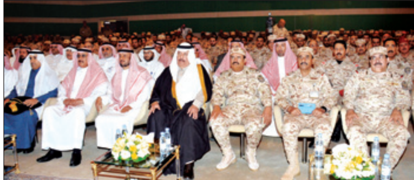
كبار مسؤولي الوزارة وأعضاء اللجان في مهرجان الجنادرية

حضر اللقاء نائب وزير الحرس الوطني نائب رئيس اللجنة العليا للمهرجان الوطني للتراث والثقافة عبدالمحسن بن عبدالعزيز التويجري، ورئيس الجهاز العسكري الفريق محمد بن خالد الناهض، وكبار المسؤولين بوزارة الحرس الوطني من مدنيين وعسكريين ورؤساء وأعضاء اللجان العاملة بالمهرجان.