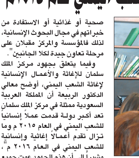
د. الربيعية متحدتاً إلى الصحفيين

صحية أو غذائية أو الاستفادة من خبراتهم في مجال البحوث الإنسانية، لذلك فالمؤسسة والمركز مقبلان على مرحلة تعاون جيدة لكلا الجانبين". وفيما يتعلق بجهود مركز الملك سلمان للإغاثة والأعمال الإنسانية لإغاثة الشعب اليمني، أوضح معالي الدكتور الربيعية أن الملكة العربية السعودية ممثلة في مركز الملك سلمان تعد أكبر دولة قدمت عملاً إنسانياً للشعب اليمني في العام ٢٠١٥م وما تزال تقدم أعمالاً إغاثية وإنسانية للشعب اليمني في العام ٢٠١٦م، مشيراً إلى أن هذه الجهود عمت جميع مدن ومحافظات اليمن وبصرف النظر عن يقطن في تلك المدن أو المحافظات. وقال المستشار في الديوان الملكي والمشرف العام على مركز الملك سلمان للإغاثة والأعمال الإنسانية: "بالنسبة للمناطق المحاصرة وبالذات مدينة تعز كان المركز هو الجهة الوحيدة التي استطاعت كسر الحصار والدخول إلى المدينة والقيام بعمليات نوعية جيدة وهي إسقاط مساعدات ومواد إغاثة طبية وغذائية من الجو، وأصبحت -ولله الحمد- هذه الجهود ملموسة لدى الشعب اليمني بشكل عام وسكان تعز بشكل خاص".