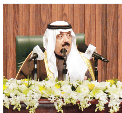
الأمير متعب بن عبدالله خلال اللقاء

لإنجاح المهرجان، وثمن وزير الحرس الوطني جهود وزارة الثقافة والإعلام الدائمة في إنجاح فعاليات المهرجان، مقدماً شكره لمختلف وسائل الإعلام على ما طرح من آراء وملاحظات تساهم في تطوير أنشطة المهرجان، مرجحاً بأي اقتراحات تسعى لتطوير فعاليات