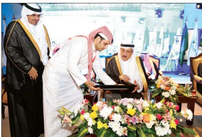
الأمير محمد بن ناصر مفتحاً فعاليات الملتقى