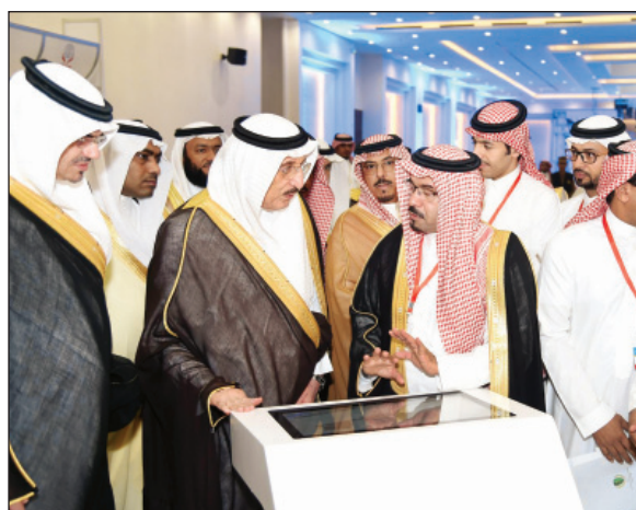
المشروع حقق نجاحات كبيرة خلال الفترة الماضية

حضر الحفل المسلم ويسعى إلى حمايته من المسكرات وما يذهب العقل بتشريعات تحفظ للمسلم عرضه ودينه وخلقه وتعاقب كل من يتجاوز الشرع ويستهدف الضرر بالأسرة والمجتمع بتنفيذ الأحكام الصارمة ضد مروجي المخدرات، مبرزاً الجهود التي تبذلها الحكومة الرشيدة في التصدي لعمليات التهريب التي تأتي من خارج حدود الوطن. وحضر الحفل سلطان بن أحمد السديري وكيل الإرساء للشؤون الأمنية، واللواء ناصر بن صالح الدويهي مدير شرطة منطقة جازان، واللواء محيا العتيبي قائد حرس الحدود بالمنطقة، والعقيد سعد بن محمد جغيلم مدير فرع إدارة مكافحة المخدرات بالمنطقة، وعدد من المسؤولين بالمنطقة.