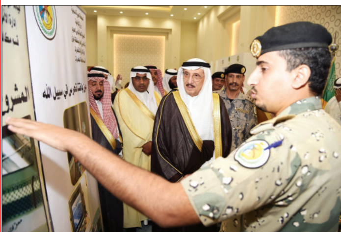
سموه يطلع على أهداف المشروع الوطني (عسرة/مرزوق الفيغي)