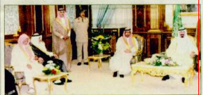
سمو ولي العهد لدى استقباله الأمراء والوزراء

الرياض - واس: استقبل صاحب السمو الملكي الأمير عبد العزيز ولي العهد بالرياض أمس البقية ص34