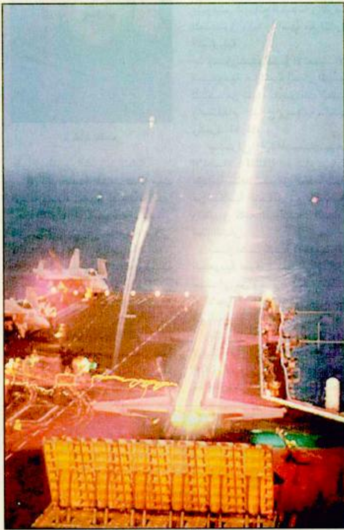
صواريخ كروز تنطلق من إحدى حاملات الطائرات

بدأت الحرب في أفغانستان بهجوم شامل من قبل الطائرات الأمريكية والبريطانية وتركزت الضربات الأولى على محيط مطار كابول ونالت الطائرات من مواقع حركة طالبان في مواقع عديدة، حيث تعرضت تلك المواقع في العاصمة كابول لانقطاع الكهرباء، ودوت القذائف وانتشرت الانفجارات والمضادات في أرجاء العاصمة التي تعرضت الى هجمات مكثفة من الطائرات. وأكدت وزارة الدفاع الأمريكية بدء الهجوم على أفغانستان بحسب ما ذكرته شبكة سي ان ان الأمريكية الاخبارية البارحة. كما ذكر شهود عيان ان ثلاث ومضات كبيرة اضاءت سماء الجبهة الشمالية بين طالبان وقوات المعارضة الشمالية على بعد نحو 40 كيلومترا شمال العاصمة كابول امس الأحد. وقد أعلنت سي ان ان، ان الغارات العسكرية التي استهدفت أمس الأحد مطار قندهار، قاعدت حركة طالبان الحاكمة في كابول. دمرت مقر قيادة الحركة.