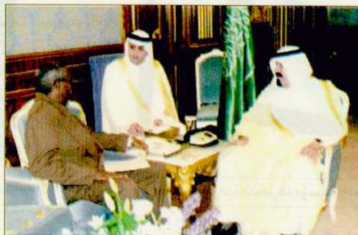
سمو ولي العهد يستقبل سفير الهند والتبوتيا