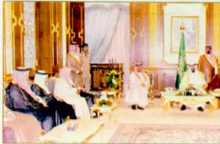
سموه يستقبل الأبراء وجمعاً من المواطنين