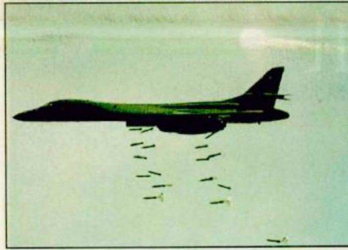
القاذفة الأمريكية «ب 1» تلقي صواريخها بينما يظهر صاروخ بطاردها