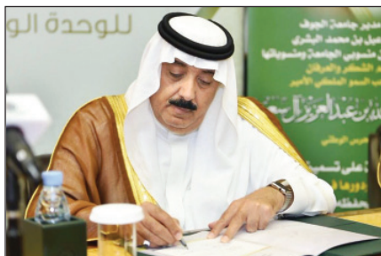
الأمير متعب بن عبدالله يوقع وثيقة الكرسي

حضر الاستقبال ومراسم التوقيع نائب وزير الحرس الوطني عبد المحسن بن عبدالعزيز التويجري وعميد معهد البحوث والدراسات بجامعة الجوف د. محمد الصالح. وفي نهاية اللقاء قدم مدير جامعة الجوف لسمو الأمير متعب بن عبدالله مجموعة من إصدارات الجامعة العلمية وهدية تذكارية بهذه المناسبة.