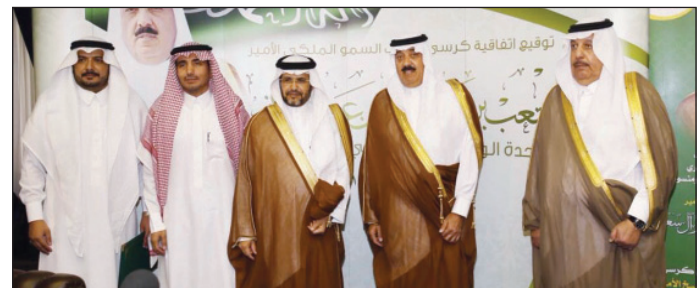
وزير الحرس الوطني ونائبه ومدير جامعة الجوف خلال مراسم التوقيع