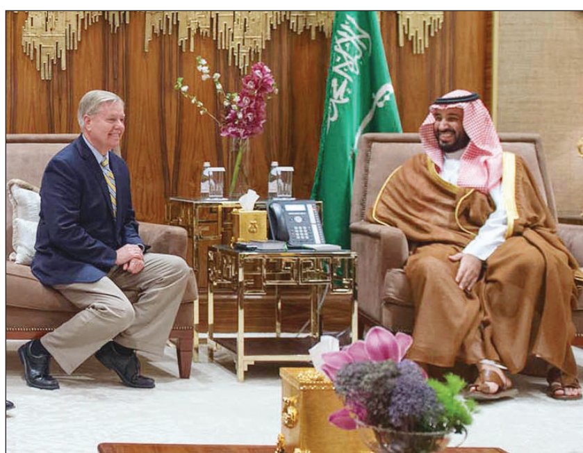
ولي ولي العهد مستقبلاً الوفد الأميركي