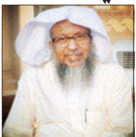
الشيخ محمد أيوب - رحمه الله -

المدينة المنورة - سالم الأحمد، خالد الزايد انتقل إلى رحمة الله تعالى الشيخ د. محمد أيوب محمد يوسف إمام الحرم النبوي سابقاً بعد صلاة فجر أمس السبت.