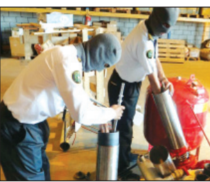
الضبوطات مخبأة في مضخات مياه

الرياض - خالد العوفي تمكن جمرك مطار الملك عبد العزيز الدولي بجده من إحباط محاولة لتهريب كمية من حيوب الكبتاغون بلغت (٦٥,٢٦٥) حبة، بالإضافة إلى إحباط محاولة تهريب كمية من الهيروين بلغت (٦٩٩) غراماً.