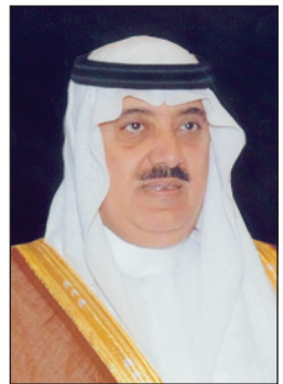
الأمير متعب بن عبدالله

الرياض - محمد الحيدر اجريت لصاحب السمو الملكي الامير متعب بن عبدالله بن عبدالعزيز وزير الحرس الوطني في مدينة الملك عبدالعزيز الطبية صباح امس السبت بعض الفحوصات الطبية كما اجريت لسموه عملية جراحية بالمنظار تكللت بالنجاح وحالته الصحية مطمئنة ومستقرة ولله الحمد.