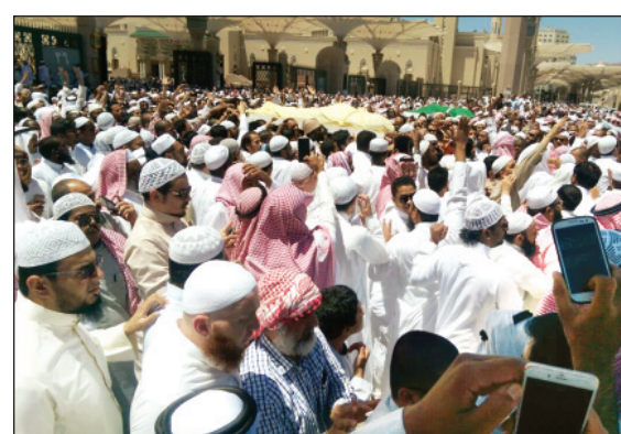
الآلاف شاركوا في تشييع جثمان الفقيد