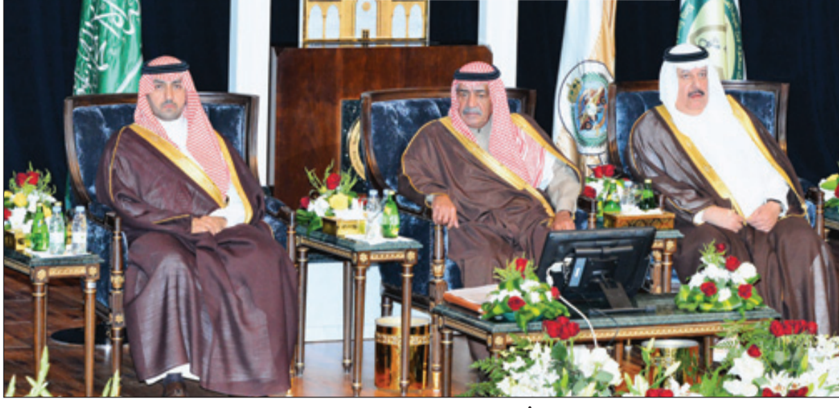
الأمير مقرن.. حضور دائم في كل المحافل العلمية