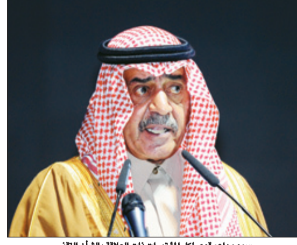
سموه داعم قوي لكل المؤتمرات ذات العلاقة بالشأن التقني

الوزراء أحد القيادات السعودية التي وفقت وراء إنجازات الحكومة الإلكترونية ومتابعة تطورها، حيث رعى أكثر من مناسبة خاصة للتعاملات الإلكترونية الحكومية، وكان يستحث الجهات الحكومية على سرعة الانتقال للتعاملات الإلكترونية، حيث يقول في إحدى تلك المناسبات: "لا عذر بعد اليوم لمن يتأخر في التحول للتعاملات الإلكترونية الحكومية في ظل الدعم الكبير الذي توليه الدولة، نتطلع لمزيد من التقدم في مجال التحول للتعاملات الإلكترونية الحكومية ورؤية المزيد من النماذج المتميزة للجهات الحكومية بمشاريع وخدمات مبتكرة تعكس ما تنفذه هذه الجهات من أعمال وجهود". ويتذكر الجميع كلمة الأمير مقرن خلال رعايته حفل جائزة الإنجاز للتعاملات الإلكترونية الحكومية في دورتها الثالثة التي نظمه وزارة الاتصالات وتقنية المعلومات، ممثلة في برنامج التعاملات الإلكترونية الحكومية (يسر)، حين قال "إنه لا يخفى على أحد النهج التنموي الذي تتبناه المملكة بقيادة حكيم من أجل تنفيذ الكثير من المشاريع والمبادرات