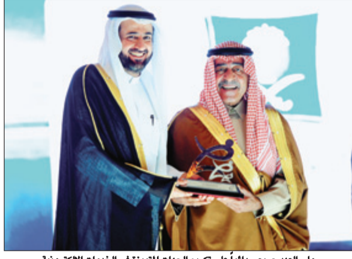
ولي العهد حريص دائماً على تكريم الجهات المتميزة في الخدمات الإلكترونية