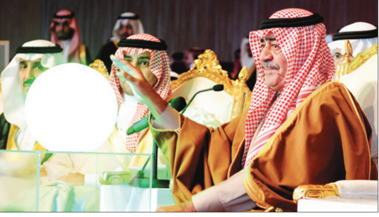
ولي العهد حريص على التحول السريع للتعاملات الإلكترونية في جميع مؤسسات الدولة