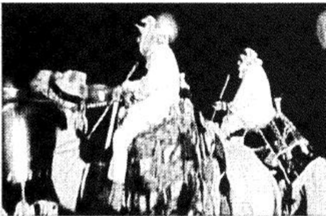
القريات - جريد الجريد:

ضمن فعاليات مهرجان القريات الصيفي لهذا العام تقدم عروض الهجن كل يوم أمام (بيت الشعر) أمام مطار القريات حيث تشكل أجمل صور التراث والموروث الشعبي متمثلة في عروض الركائب (الهجانة) وهو الاسم الذي يطلق على راكبي الهجن وعبر هذه التسمية عرف التراث نوعاً من أنواع الشعر أطلق عليه (الهجنيني) حيث يردد الهجانة من على ظهور جمالهم في سفرهم وترحالهم ويعتمد على (المراداة) وهو نوع من الشعر النبطي ويتألف شطر البيت الواحد من ثلاث كلمات أو خمس على حسب الوزن والطاوق (البلاغة) وفي الوقت الحاضر يؤدي في المناسبات التراثية وأسلوب تآديته بينما تكون الهجن بين المشي والجري ويسمى في سلم البداية (بالذوال) وتم تجهيز الركائب (بالاشدة) وال (الخروج) والمزاود) والدلال) والسفايف) وهي بعض المنسوجات القديمة التي توضع على ظهور الهجن وتعرف بهذه المنسوجات.