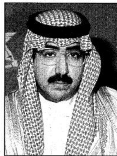
الأمير فيصل بن عبدالله