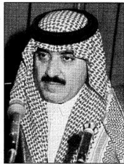
الأمير مubarak بن عبدالله بن عبدالعزيز