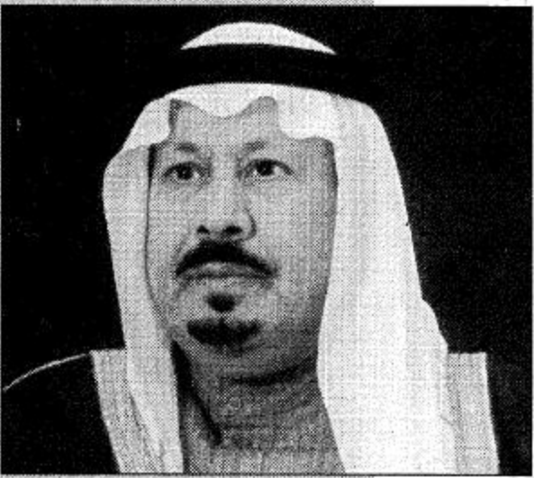
الأمير بدر بن عبدالعزيز