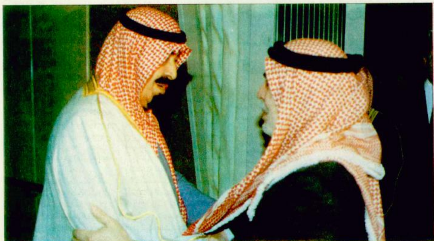
(الصور من واس)