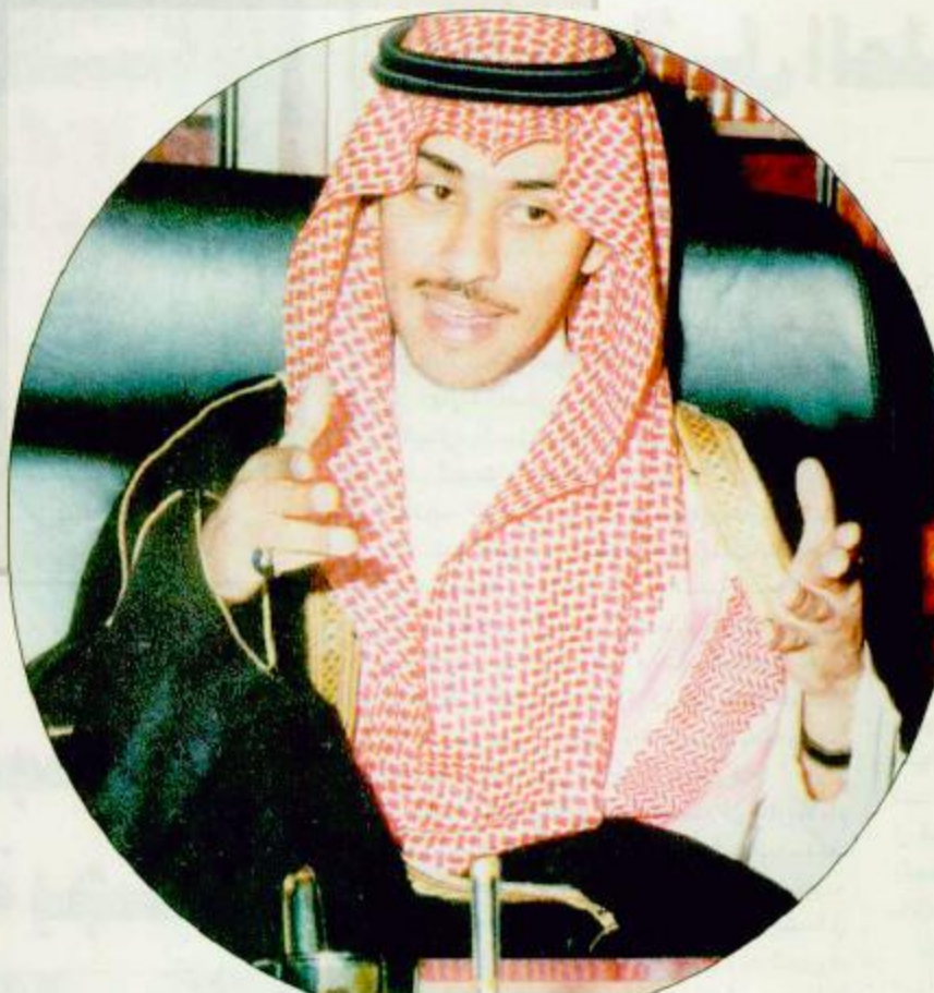
□ سمو الأمير منصور بن عبد الله بن عبدالعزيز

بدأ جدنا الملك عبدالعزيز عملية بناء الإنسان السعودي بعمليات متكاملة ومتتابعة بتوفيره عنصر الأمن والأمان والاستقرار وذلك بإنشاء الهجرة اللازمة لعملية المواطنين... وإعلانه عن عقيدة الدولة وقامة الحدود وعسن نهج وأخلاقيات الحكم - بأن