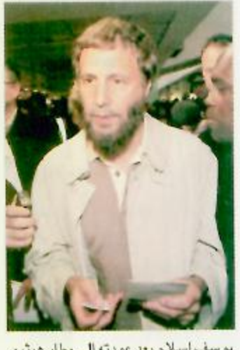
يوسف إسلام بعد عودته إلى مطار هيثرو

سترو يؤنب نظيره الأمريكي على طرد يوسف إسلام لندن - واشنطن - الوكالات: قال وزير الخارجية البريطاني جاك سترو لنظيره الأمريكي كولن باول إن الولايات المتحدة ما كان يجب أن تطرد المغني البريطاني يوسف إسلام الذي كان اسمه كان ستيفنز قبل أن ينشر إسلامه، وقد أعربت منظمات بريطانية وأمريكية مسلمة عن صدمتها إزاء القرار الذي اتخذته السلطات في الولايات المتحدة الأمريكية. ونسبت وكالة الأنباء البريطانية (برس أسوسييشن) مساء الأربعاء إلى المتحدث باسم سترو قوله إن وزير الخارجية البريطاني المجرى في نيويورك حالياً حيث يشارك في أعمال الجمعية العامة للأمم المتحدة بحث مع نظيره الأمريكي في رفض أجهزة الهجرة الأمريكية السماح لجنح اللجوء السابق الذي اعتنق الإسلام بدخول الأراضي الأمريكية (لأسباب تتعلق بالأمن القومي). وقال المتحدث إن سترو أكد لباول إن (هذا الإجراء ما كان يجب أن يتخذ). وكان مسؤول عن الأمن الداخلي في واشنطن أعلن عودة