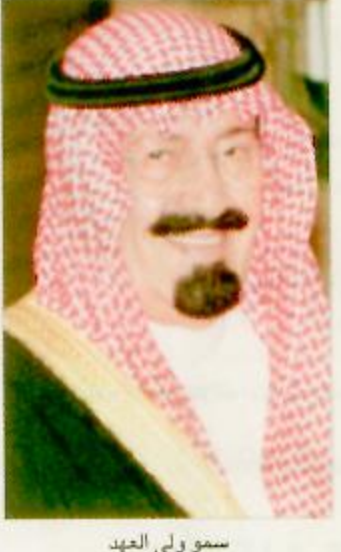
تحت رعاية صاحب السمو الملكي الأمير عبد الله بن عبد العزيز ولي العهد نائب رئيس مجلس الوزراء رئيس الحرس الوطني، وتنظم وزارة التربية والتعليم ندوة (الطفولة المبكرة: خصائصها واحتياجاتها)، وذلك خلال الفترة من ٢٦ - ٢٨ من الشهر الحالي بالرياض.

تتضمن خمسة محاور وقدم لها أكثر من ٢٥٠ بحثاً ولي العهد يري ندوة احتياجات الطفولة نهاية الشهر الرياض - عبد الرحمن المصبيح: تحت رعاية صاحب السمو الملكي الأمير عبد الله بن عبد العزيز ولي العهد نائب رئيس مجلس الوزراء رئيس الحرس الوطني، وتنظم وزارة التربية والتعليم ندوة (الطفولة المبكرة: خصائصها واحتياجاتها)، وذلك خلال الفترة من ٢٦ - ٢٨ من الشهر الحالي بالرياض. ويهدف البرنامج أعرب معالي الدكتور محمد الأحمد الرشيد وزير التربية والتعليم عن عظمة امتنانه وسعادته لتفضل سمو ولي العهد ورعايته لهذه المناسبة والتي سيكون لها عظيم الأثر في نفوس المجتمع. وقال معاليه: إن هذه الندوة تهدف إلى تعزيز الوعي بخصائص واحتياجات الطفولة المبكرة، والتعرف على واقع الطفولة المبكرة في المملكة وما يقدم لها من أوجه الرعاية التربوية وتفعيل الأنظمة التي تتصل بحقوق الطفل ورعايته إضافة إلى إبراز دور مؤسسات التنشئة الاجتماعية (الأسرة، المجتمع، المدرسة، وسائل الإعلام) لدعم هذا الجانب والإفادة من تجارب الدول الأخرى وتتضمن الندوة خمسة محاور رئيسية هي المحور الأول: خصائص واحتياجات الطفولة، والمحور الثاني: السياسات والخطط في مجال الطفولة، والمحور الثالث: الدراسات والبحوث في مجال الطفولة، أما المحور الرابع البرامج والمشروعات الخاصة بالطفولة، أما المحور الخامس مؤسسات التنشئة الاجتماعية.