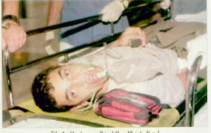
أحد الجنود الإسرائيليين الجرحى في المستقلة