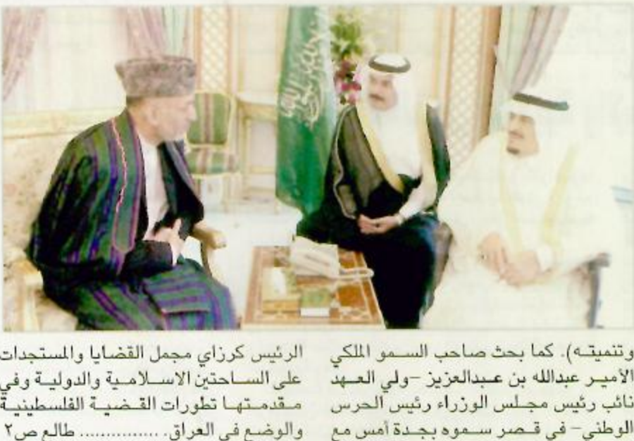
استقبل خادم الحرمين الشريفين الملك فهد بن عبدالعزيز آل سعود في مكتبه بقصر السلام أمس فخامة الرئيس حامد كرزاي رئيس دولة أفغانستان الإسلامية والوفد المرافق له.

خادم الحرمين وولي العهد يبحثان مع الرئيس الأفغاني المستجدات الدولية كرزاي: الملك فهد له دور رئيسي في استقرار أفغانستان جدة - واس: استقبل خادم الحرمين الشريفين الملك فهد بن عبدالعزيز آل سعود في مكتبه بقصر السلام أمس فخامة الرئيس حامد كرزاي رئيس دولة أفغانستان الإسلامية والوفد المرافق له. وقد استعرض خادم الحرمين الشريفين وكرزاي مستجدات الأحداث على الساحتين الإسلامية والدولية، خاصة الوضع في فلسطين والعراق. وقال فخامة الرئيس كرزاي (إننا في أفغانستان ممنون جداً ونكن كل تقدير واحترام لما تقدمه الملكة العربية السعودية من دعم وتأييد للشعب الأفغاني... مثنمين الدعم السخي والاهتمام البالغ من خادم الحرمين الشريفين الذي كان له دور رئيسي في استقرار أفغانستان وتتمتع). كما بحث صاحب السمو الملكي الأمير عبدالله بن عبدالعزيز - ولي العهد نائب رئيس مجلس الوزراء رئيس الحرس الوطني - في قصر سموه بجدة أمس مع الرئيس كرزاي مجمل القضايا والمستجدات على الساحتين الإسلامية والدولية وفي مقدمتها تطورات القضية الفلسطينية والوضع في العراق. طالع ص ٢