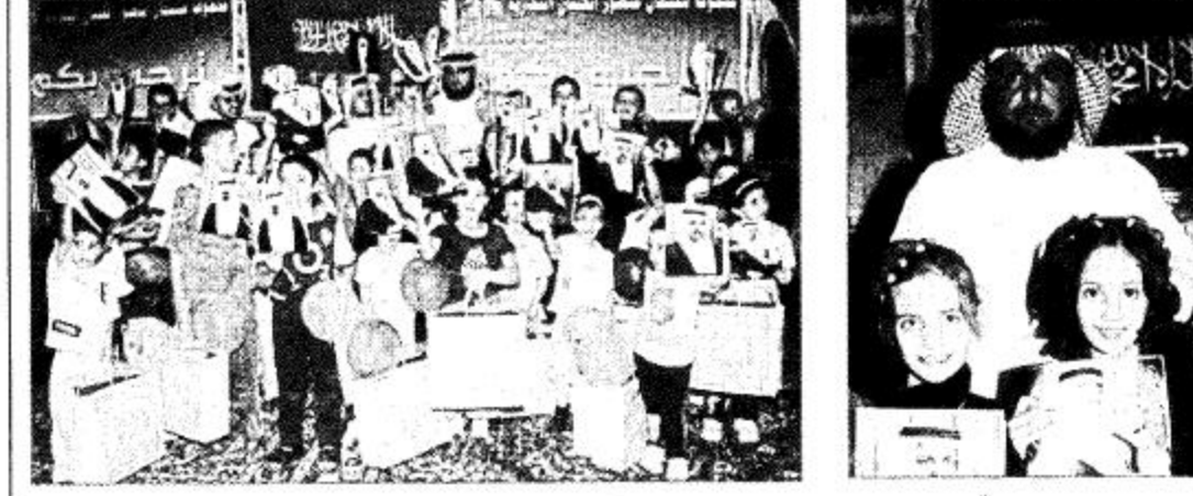
الشيخ عبدالعزيز بن عبد الله آل الشيخ

الحضور، عقب ذلك قدمت مسرحية للطفل بعنوان (غاية الأرقام) من تأليف سعد الدهش. ثم قدمت فرقة أبطال العروض عددا من الحركات الاستعراضية، ثم قام الأستاذ سليمان منصور العيلان بتكريم الأيتام بالهدايا وعبر عن اعتزازه بهذه المناسبة الوطنية الغالية. كما جرى خلال الاحتفال توزيع صور للملك عبد العزيز وأبناؤه الملك فهد والأمير عبد الله والأمير سلطان والأمير تاييف والأمير سلمان. ثم التقطت الصور التذكارية بهذه المناسبة.