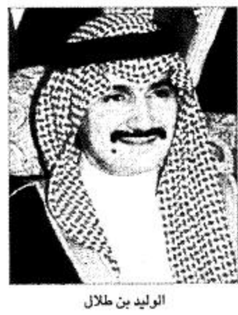
الأمير الوليد بن طلال

وبإدارة سمو الأمير الوليد تنبع من حرص سموه على مساعدة المسلمين حول العالم على تعلم وتفهيم أمور دينهم وخاصة القرآن الكريم (خيركم من تعلم القرآن وعلمه)، فقد سبق لسموه وأن وجه بطباعة معاني القرآن الكريم بخمس لغات هي: الألبانية وطبع منها ٤٠ ألف نسخة، والسندية وطبع منها ٥٠ ألف نسخة، والهوسا وطبع منها ٥٠ ألف نسخة أيضاً. وبذلك يوفق عدد النسخ التي تمت طباعتها أكثر من ٢٠٠ ألف نسخة بست لغات.