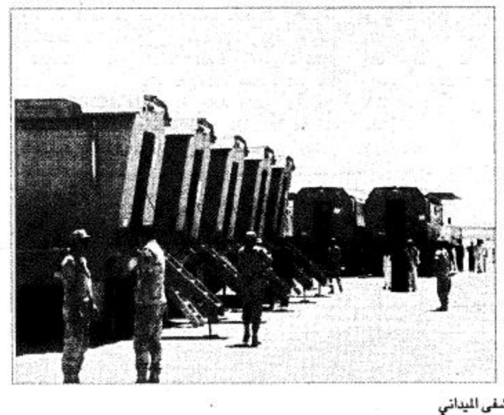
لقطان للمستشفى الميداني

ويبين بأن المستشفى الميداني الثاني يضم طاقماً سعودياً ١٠٠٪ سواء كانوا أطباء استشاريين أو إخصائين أوليين للرعاية الأولية الخمس القادم للمواقع ١٦-٨-١٢٥٥ وذلك بعد تجهيزه وأخذ موقعه في المنطقة المخصصة له هناك.