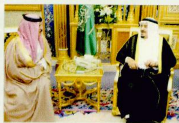
جانب من الاستقبال