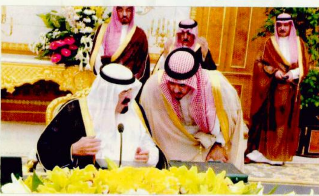
الرياض - واس:

راس صاحب السمو الملكي الأمير عبدالله بن عبدالعزيز ولي العهد نائب رئيس مجلس الوزراء رئيس الحرس الوطني - حفظه الله - جلسة مجلس الوزراء التي عقدها بعد ظهر أمس الإثنين في قصر اليمامة بمدينة الرياض.