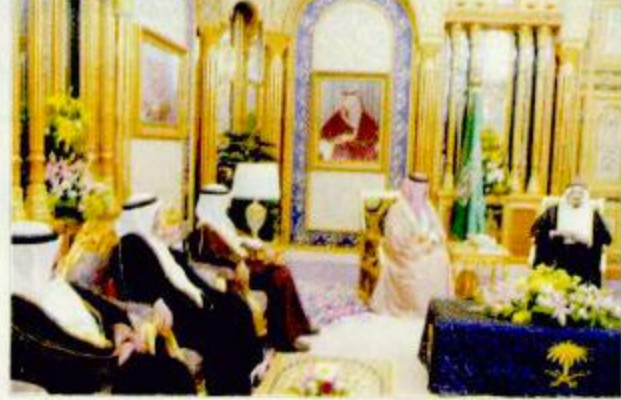
الرياض - واس:

استقبل خادم الحرمين الشريفين الملك فهد بن عبدالعزيز آل سعود - حفظه الله - في قصر اليمامة أمس اخاه صاحب الجلالة الملك حمد بن عيسى آل خليفة ملك مملكة البحرين برفقة صاحب السمو الشيخ خليفة بن سلمان آل خليفة رئيس الوزراء والوفد المرافق لجلالته. وقدم جلالة الملك حمد بن عيسى والشيخ خليفة بن سلمان تهنيتيهما وتعازي حكومة وشعب البحرين لخادم الحرمين الشريفين وفي وفاة الفقيد صاحب السمو الملكي الأمير ماجد بن عبدالعزيز رحمه الله.