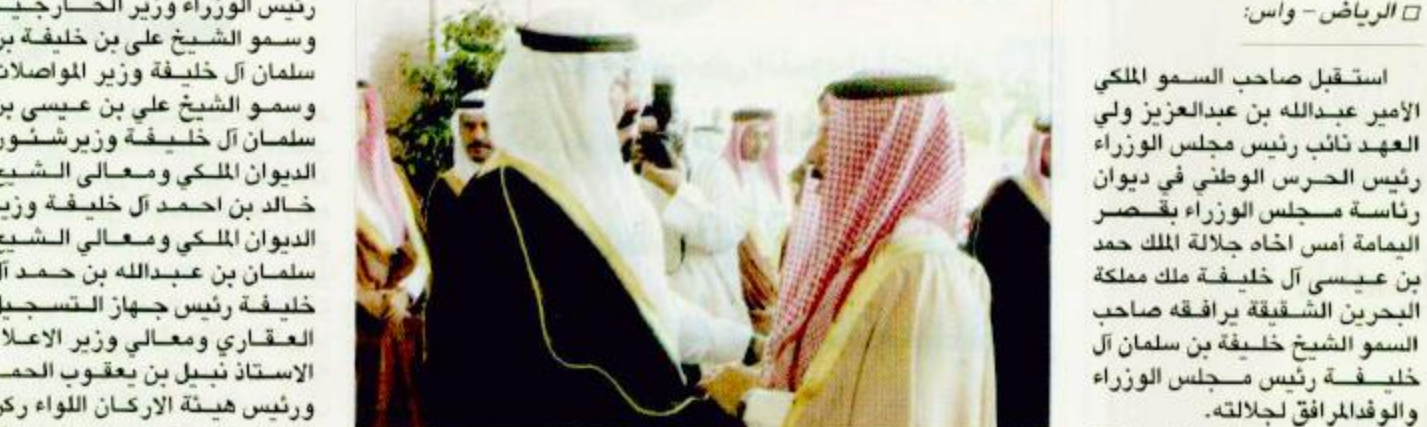
جانب من الاستقبال

الرياض - معالي وزير الدولة عضو مجلس الوزراء الدكتور مساعد العبيان: يستقبل صاحب السمو الملكي الأمير عبدالله بن عبدالعزيز ولي العهد نائب رئيس مجلس الوزراء رئيس الحرس الوطني في ديوان الرئاسة أمس اخاه جلالة الملك حمد بن عيسى آل خليفة ملك مملكة البحرين برفقة صاحب السمو الملكي الأمير سلطان بن فهد بن عبدالعزيز نائب رئيس الاستخبارات العامة وصاحب السمو الملكي الأمير أحمد بن عبدالعزيز وزير الأشغال العامة والإسكان وصاحب السمو الملكي الأمير سعود بن فهد بن عبدالعزيز نائب رئيس الاستخبارات العامة وصاحب السمو الملكي الأمير عبد العزيز بن فهد بن عبدالعزيز وزير الدولة عضو مجلس الوزراء رئيس ديوان رئاسة مجلس الوزراء ومعالى رئيس الديوان الملكي الأستاذ محمد النويص ومعالى المستشار الخاص لخادم الحرمين الشريفين الأستاذ إبراهيم العنقري ومعالى وزير الدولة عضو مجلس الوزراء الدكتور عبد العزيز الخويطر ومعالى وزير الدولة عضو مجلس الوزراء الدكتور مساعد العبيان ومعالى نائب رئيس ديوان رئاسة مجلس الوزراء الأستاذ صالح إبراهيم والمستشار في الديوان الملكي الدكتور فهد إبراهيم ومعالى نائب رئيس المكتب الخاص لخادم الحرمين الشريفين الأستاذ سليمان بن الأمير.