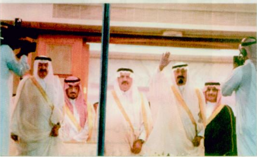
سمو ولي العهد يحيي الجماهير الفعيرة