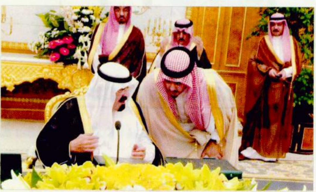
الرياض - واس:

راس صاحب السمو الملكي الأمير عبدالله بن عبدالعزيز ولي العهد نائب رئيس مجلس الوزراء رئيس الحرس الوطني - حفظه الله - جلسة مجلس الوزراء بعد ظهر أمس الاثنين في قصر اليمامة بمدينة الرياض. واطلع المجلس في استهل الجلسة على تقارير حول الوضع في العراق الشقيق وما آلت اليه الأوضاع هناك من انعدام الأمن والاستقرار وما نتج عنه من عمليات القوضي والسلب والنهب وتقص في الماء والغذاء والدواء. وبين معالي وزير الإعلام الدكتور فؤاد بن عبدالسلام الفارسي في بيانه لوكالة الأنباء السعودية عقب الجلسة أن سمو ولي العهد - حفظه الله - جدد في حديثه للمجلس قلق المملكة العربية السعودية حكومة وشعباً مما تشهده المن العراقية من انفلات أمني سيؤدي استمراره إلى كارثة إنسانية قد يذهب جواها الكثير من الأبرياء والمستنكبات فضلاً عما تتعرض له المعالم التاريخية والحضارية في العراق من خسائر، مشدداً: أبده الله - على ضرورة تحقيق الأمن والاستقرار في العراق بأسرع وقت ممكن وتمكين شعبه من اختيار الطريقة التي يراها لإدارة شؤونه.