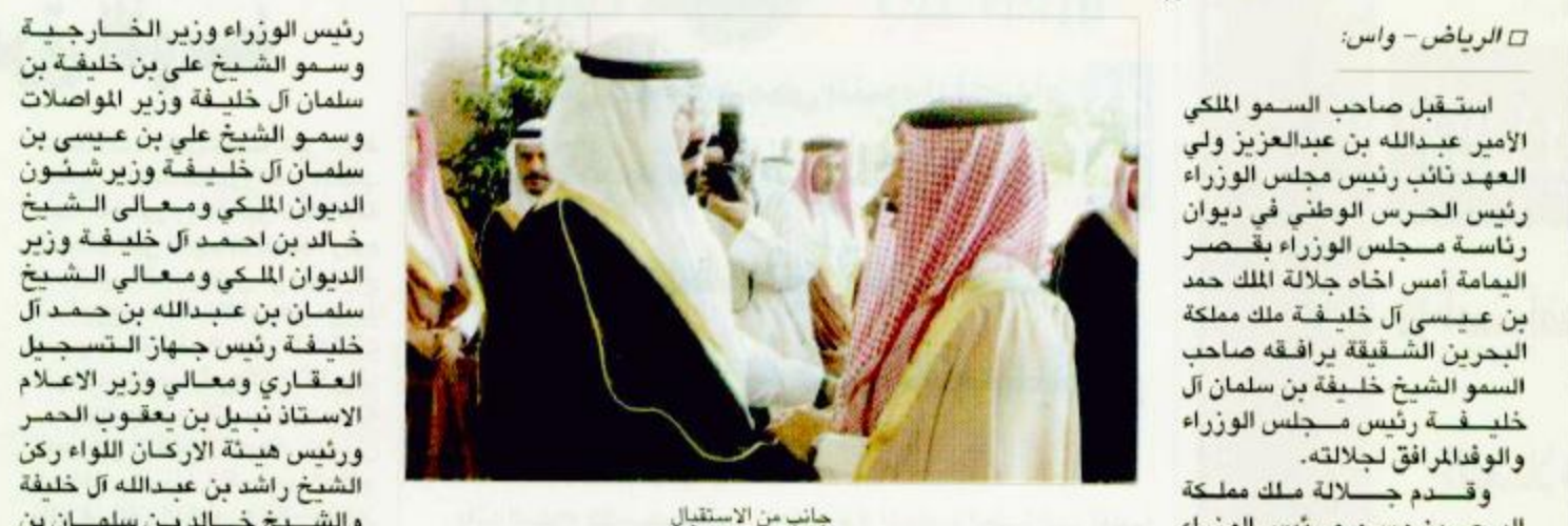
جانب من الاستقبال

الرياض ومعالى وزير الدولة عضو مجلس الوزراء الدكتور مساعد العبيان.