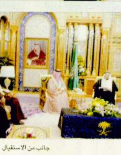
جانب من الاستقبال

استقبل خادم الحرمين الشريفين الملك فهد بن عبدالعزيز آل سعود - حفظه الله - في قصر اليمامة أمس اخاه صاحب الجلالة الملك حمد بن عيسى آل خليفة ملك مملكة البحرين برفقة صاحب السمو الشيخ خليفة بن سلمان آل خليفة رئيس الوزراء والوفد المرافق لجلالته. وتعازبهما وتعازي حكومة وشعب البحرين لخادم الحرمين الشريفين في وفاة الفقيد صاحب السمو الملكي الأمير ماجد بن عبدالعزيز رحمه الله.