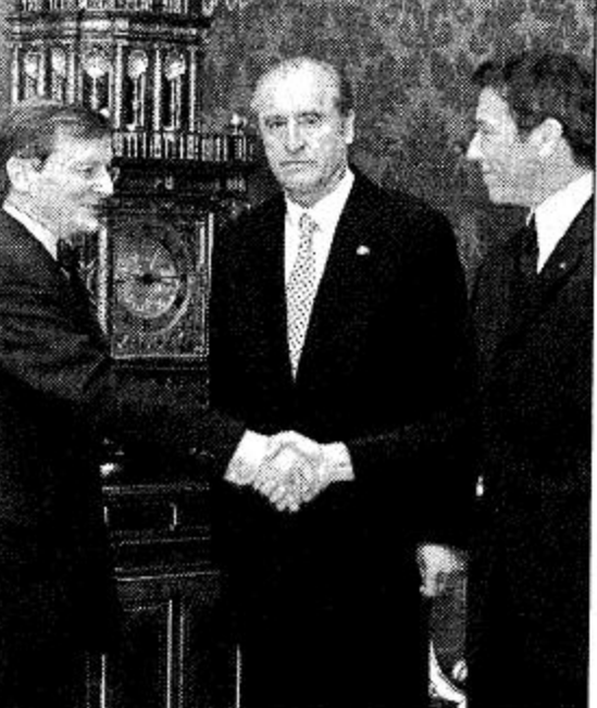
فيينا- النمسا: الحزب: الرئيس النمساوي توماس كليستيل (وسط) يرافقه جورج هيدزيمع الرئيس النمساوي وهو يصافح زعيم حزب الشعب المحافظ في فيينا.

الحكومة) الى طمأننة الرأي العام الداخلي والخارجي بتوقيع زعيمه فولفغانغ شوبسل تعهدا خاصا مع هايدز امس ينص على احترام حقوق الانسان والقيم الديمقراطية والافرار بمسؤولية الحزب العالية الثانية.