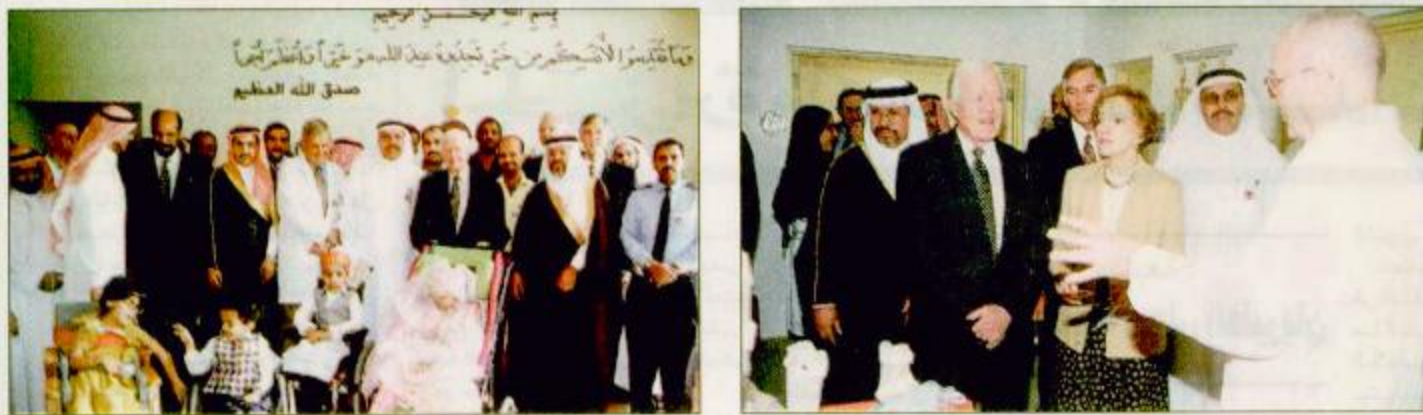
كارتر يستمع لمسؤولي الجمعية ○ الرئيس الأمريكي السابق مع الأطفال المعاقين ○