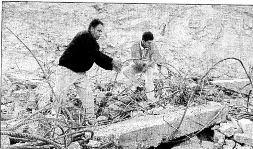
القائد العام للحزب، القائد الفلسطيني عبدالرزاق الشفيح (يمين) يبحث وسط حطام منزله الذي هدمته الجرافات الاسرائيلية للمرة الثانية في ضاحية العيسوية بالقس.

كثرت المجاور لمنطقة جزين التي احتلها في ايار/ مايو الماضي. وقد أكد الجيش الاسرائيلي انسحابه من موقع مسجد وأوضاع مصدر عسكري اسراييلي ان تم إخلاء الموقع فجر امس الجمعة وأن عناصر ميليشيا الجنوبي تغلوا في موقعين آخرين في القطاع نفسه.