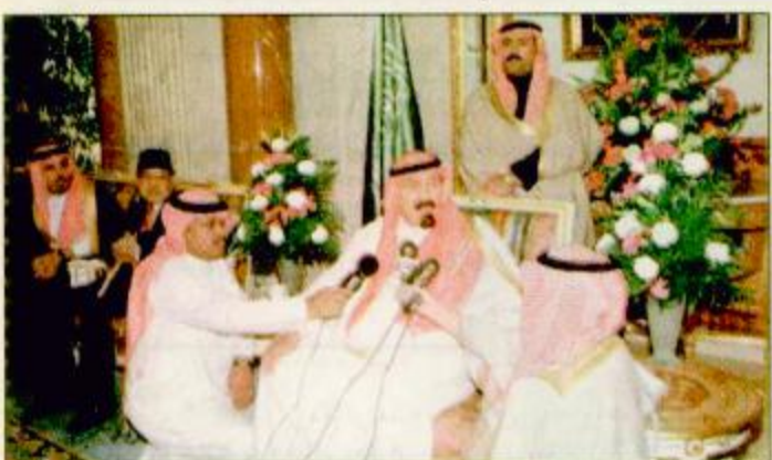
سمو ولي العهد الأمير عبدالله يستقبل ضيوف الحرس الوطني المشاركين في الجنادرية