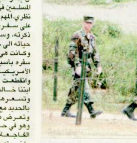
لقطة أرضية لمعتقل في قاعدة غوانتانامو