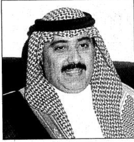
○ الأمير متعب بن عبد الله

«أوبريت العام القادم، والتصوير النسائية التي لم ترتق للمستوى المطلوب وقضايا اخرى هامة. ○ كان شاعر الرومان الشاعر الكبير خلف بن هذال متعلقاً بكعنته ف بكل مناسبة وطنية وقد الهب الشاعر تفاعلاً والاكت تصديقاً.