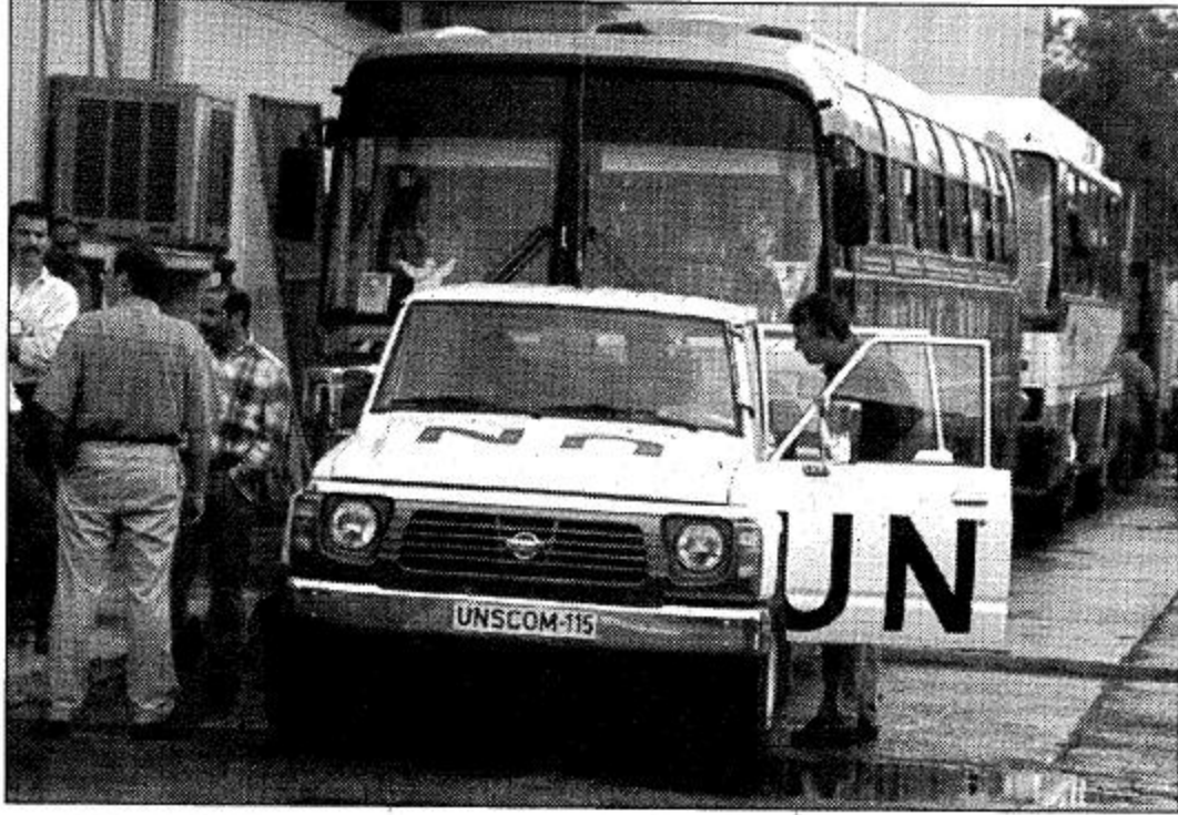
بغداد، العراق. ا. ب. ف. ب. أعضاء لجنة الأمم المتحدة الخاصة والمسؤولة عن نزع تسليح العراق يستمعون لمغادرة العراق.