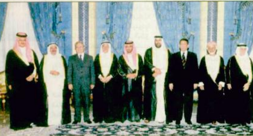
وزراء خارجية دول إعلان دمشق قبل بدء اجتماعاتهم

ويعرب عن أمله في أن يكون هذا الاجتماع للمنطقة نحو رسم استراتيجيّة متكاملة وقادرة على تحقيق الطموحات والآمال وخدمة للأهداف المشتركة التي يتوجب العمل على بلوغها. وطالب وزير الخارجية القطري في هذا الصدد بوقفه مع الذات لتقييم مسيرة الإعلان بهدف تطويرها وتعزيزها في المستقبل.. مؤكداً على أهمية عقاب اجتماعات وزراء خارجية دول الإعلان بصورة دورية ومنظمة وفي مواعيد محددة. وأعرب وزير الخارجية القطري عن أسفه للمصاعب الجمة التي تواجه عملية السلام وتهدد استمرارها ونجاحها محملاً مسؤولية هذا الوضع.. مشيراً إلى هذا الصدد إلى أن هذه الأيام تشهد محاولات معاتلة بهدف تفتيدها وحكومتها من خلالها الماطلة في تنفيذ اتفاق راي ريفر. الدوحة - واس ٢٩ ص