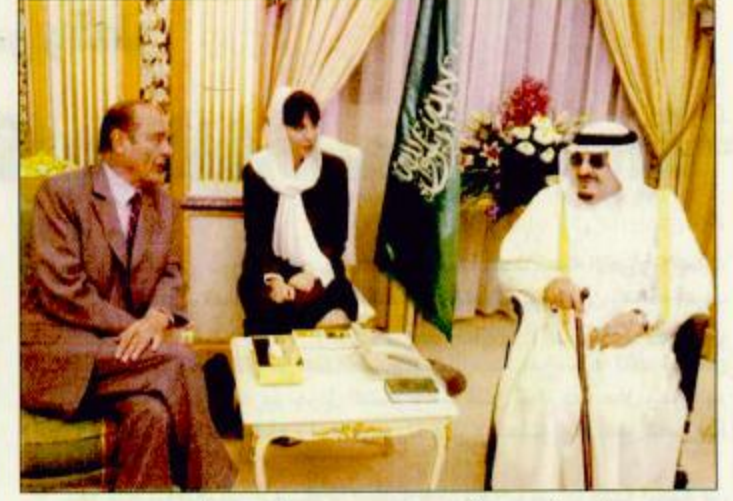
□ خادم الحرمين الشريفين يجتمع مع الرئيس الفرنسي □