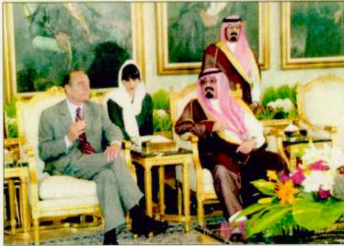
□ سمو ولي العهد يجتمع مع الرئيس الفرنسي □

ومن شأن ذلك أن يجنب العالم إفرازات صراع مستفحل بالفعل ويعزز الثقة بين الدول طالما أنه تؤخذ في الاعتبار تطلعات كل الدول وقضاياها العادلة من قبل الكيانات الكبرى في عالم اليوم.