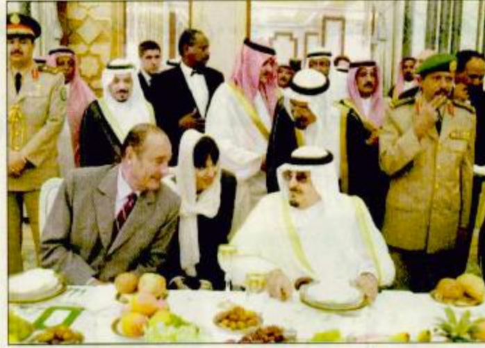
□ حفل عشاء للرئيس شيراك □