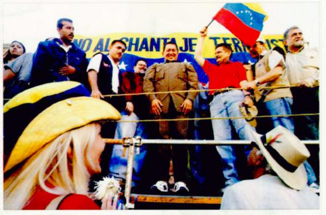
شافيز بين مؤيديه أثناء الفاتح كلمة حث فيها على التزام الهدوء

في تحد للمعارضة التي تسعى لإجباره على التخلي عن السلطة يستعد الرئيس الفنزويلي هوغو شافيز لمحاولة إنهاء إضراب سبب شللاً عاماً في قطاع النفط في أكبر خامس دولة مصدرة للنفط في العالم. وأبعد يومين من سقوط ثلاثة قتلى أثناء مظاهرة مناهضة لشافيز مما أشعل التوترات في البلاد بكافح الرئيس لاستعادة السيطرة على قطاع النفط من قاندي التناقل المضربين عن العمل ومسؤولي شركة البترول الوطنية. وتكثف النزاع السياسي المرير بين شافيز ومعارضيه منذ بدأ الإضراب ليستتبع في ضغوط على عمليات النفط في فنزويلا التي تعد الولايات المتحدة بنحو ١٥ في المئة من إجمالي وارداتها النفطية. وأدى الإضراب إلى اضطراب عمليات الشحن والمصافي وتقييد الاقتصاد الذي يعاني بالفعل من التعتير حيث تمثل إيرادات النفط نصف إجمالي عائدات الحكومة. إلا أن شافيز الذي انتخب عام ١٩٩٨ وانقذ من انقلاب لم يدم طويلاً في أبريل - نيسان تجاهل ضغوط المعارضة ورفض تماماً المطالب بإجراء انتخابات فورية وقال أنه سيحسم قطاع النفط من الذين ينهزمون بمحاولة زعزعة استقرار البلاد. وصرح شافيز أمام آلاف المؤيدين الذين احتشدوا في شوارع وسط كراكاس «أناشد الناس...الانطلاق إلى الشوارع بشجاعة للدفاع عن شركة النفط الوطنية...» ووسط تزايد المخاوف الدولية نتيجة الاضطرابات السياسية في فنزويلا سعى سيزار جافيريا الأمين العام لمنظمة الدول الأمريكية لحياء محادثات السلام التي توسط فيها للتوصل إلى حل انتخابي للأزمة الراهنة.