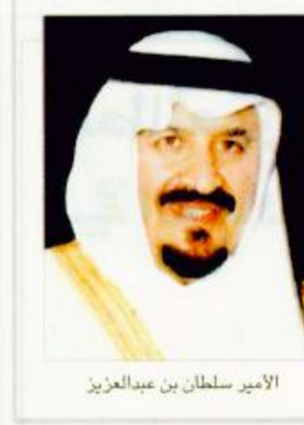
الأمير سلطان بن عبدالعزيز

قدم صاحب السمو الملكي الأمير سلطان بن عبدالعزيز النائب الثاني لرئيس مجلس الوزراء عشرة ملايين ريال تبرعاً لإنشاء مركز متطور للكلية بمنطقة الجوف. وجاء تبرع سموه بعد تشريفه مساء أمس الحفل الذي أقامته إمارة منطقة الجوف تكريماً لسموه وذلك بصالة الاستقبالات بمنزل سمو أمير منطقة الجوف، وقد بدأ الحفل بتلاوة آيات من القرآن الكريم ثم القيت عدد من الكلمات قدم من خلالها ملقوها التهنئة لخادم الحرمين الشريفين الملك فهد بن عبدالعزيز وسمو ولي عهده الأمين وسمو النائب الثاني - حفظهم الله - بمناسبة عيد الفطر المبارك معربين عن شكرهم لسموه على زيارته لمنطقة الجوف..... طالع ص ٢»