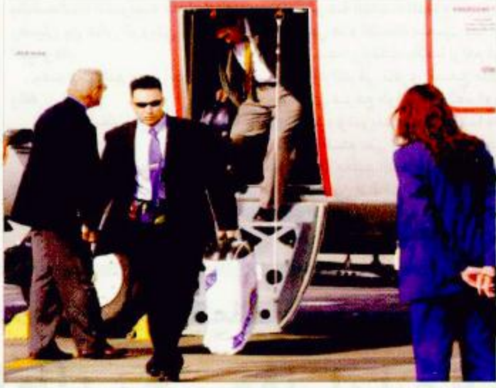
وصول فريق الأمم المتحدة إلى قبرص في طريقه إلى نيويورك حاملاً الوثائق العراقية

استشهاد فلسطينية... وإصابة جنديين إسرائيليين في الشوكة القسم - (أ.ف.ب):