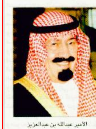
الأمير عبدالله بن عبدالعزيز

بعث صاحب السمو الملكي الأمير عبدالله بن عبدالعزيز ولي العهد نائب رئيس مجلس الوزراء رئيس الحرس الوطني بريقة شكر جوابية لمعالى وزير خارجية الولايات المتحدة الأمريكية كوران بول رداً على البرقية التي بعثها معاليه وحملت تهنئته لسمو ولي العهد بعيد الفطر المبارك وتمنيات بمزيد من البركات لشعب المملكة العربية السعودية. وقال سموه: «إننا إذ نشكركم على ما عبرتم عنه من مشاعر وتمنيات طيبة لنؤكد لكم حرصنا واهتمامنا على استمرار توثيق علاقات المودة والصداقة القائمة بين حكومتينا وشعبينا الصديقين منذ ما يزيد على نصف قرن متمنين لمعالكم موفور الصحة والهناء.»