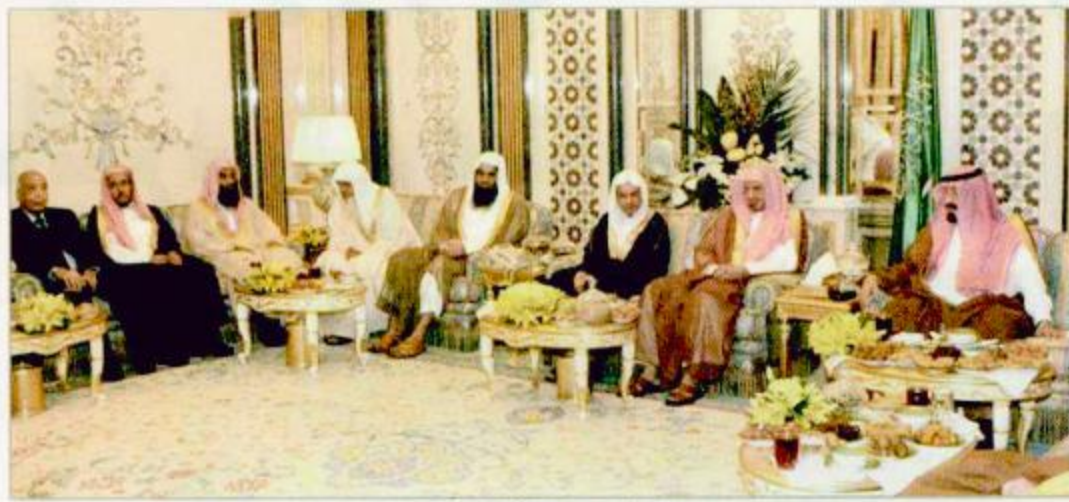
استقبال الأمير عبدالله لأئمة المسجد الحرام

استقبل صاحب السمو الملكي الأمير عبدالله بن عبدالعزيز ولي العهد نائب رئيس مجلس الوزراء ورئيس الحرس الوطني في قصر الصفا بمكة المكرمة قبل مغرب أمس معالي رئيس مجلس الشورى الشيخ صالح بن حميد ومعالي الرئيس العام لشؤون المسجد الحرام والمسجد النبوي الشريف صالح بن الحسين وأصحاب الفضيلة أئمة المسجد الحرام ومعالي الشيخ محمد السبيل والشيخ الدكتور عبدالرحمن السديس والشيخ الدكتور سعود الشريم والشيخ الدكتور أسامة خياط والشيخ صالح بن طالب وأئمة الحرم النبوي الشريف الشيخ الدكتور علي الحذيفي والشيخ حسين آل الشيخ والشيخ صالح بن دبير. وحضر الاستقبال صاحب السمو الملكي الأمير نواف بن عبدالعزيز رئيس الاستخبارات العامة وصاحب السمو الملكي الأمير فواز بن عبدالعزيز وصاحب السمو الملكي الأمير عبداللّه بن عبدالعزيز وأصحاب السمو الملكي الإسماء وأصحاب المعالي الوزراء. وقد تناول الجميع طعام الإفطار على مأدبة سمو ولي العهد.