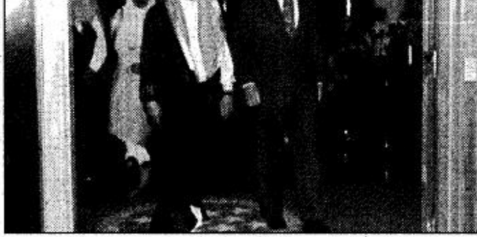
الأمير سطاتم خلال تشريفه الحفل

وكان في استقبال سموه لدى وصوله سفير الولايات المتحدة الأمريكية للملكة وايتش فالور وأعضاء السفارة.