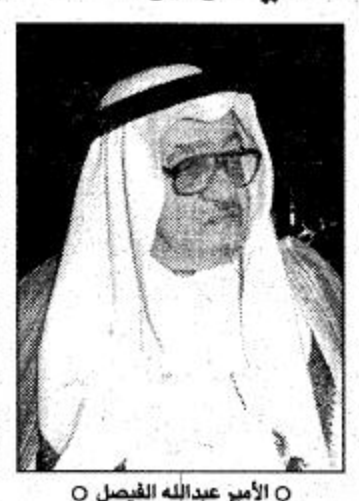
الأمير عبدالله الفيصل

بعد أن أمر سمو ولي العهد بإطلاق اسم عبدالله الفيصل على ملعب جدة الأمير سلطان بن فهد إطلاق الاسم الجديد تقديرًا لرائد الرياضة أمر صاحب السمو الملكي الأمير عبدالله بن عبدالعزيز ولي العهد ونائب رئيس مجلس الوزراء ورئيس الحرس الوطني بإطلاق اسم صاحب السمو الملكي الأمير عبدالله الفيصل على استاد الرئاسة العامة لرعاية الشباب بمحافظة جدة ليصبح مسماه الجديد استاد الأمير عبدالله الفيصل بمحافظة جدة. أعلن ذلك صاحب السمو الملكي الأمير سلطان بن فهد بن عبدالعزيز الرئيس العام لرعاية الشباب السعودية وجميع الدول العربية. وأكد سموه أن صاحب السمو الملكي الأمير عبدالله الفيصل هو رائد الحركة الرياضية في المملكة العربية السعودية متمنياً لسموه الكريم الصحة والعافية.