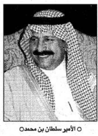
الأمير سلطان بن محمد

الغالي والثمين جدا والذي اتى كنتيجة طبيعية للجهود الكبيرة التي بذلها نجوم الهلال داخل الملعب وقيل ذلك اجتهزه الاخرى الادارية والفنية وجماهيره الوفية التي تحقت معه بصورة دائمة وأضاف سموه بالقول: ولا أدل على ذلك من الحصول على اربع بطولات كبيرة ومستحقة والبقية اليافقة في الطريق بإذن الله بدءاً ببطولة الزهراني: بسعادة بالغة قال عضو شرف نادي الهلال سمو الأمير سلطان بن محمد بن سعود الكبير الذي نزل عقب نهاية مباراة الهلال والشباب التي فاز بها الفريق الأول بثلاثية أهداف نظيفة وتوج على اثر ذلك بطلا لكأس سمو ولي العهد.. مبروك لك هذا الانجاز