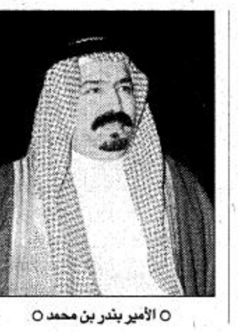
الأمير بندر بن محمد

تحققت وعن المستوى العام للمباراة قال سموه: «يا جماعة الخير» مباريات الكؤوس عامة ما تكون بتلك الصورة الفنية الخارقة للعادة بحكم حرص الفريقين على الخروج بالفوز. ولذا لم تكن مباراة الامس بذلك المستوى الذي كنا نتمناه حيث حرص من الطرفين على النتيجة.. وعن السوبر الآسيوي القادم قال: دعونا نفرح بكأس اليوم وبإذن الله تكون للهلال كلمة مشرفة في بطولة السوبر.