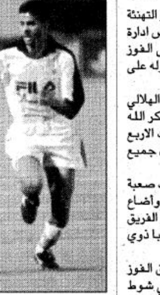
الأمير بندر بن محمد

كتيب- نبيل العبودي: قدم النجم الهلالي الكبير سامي الجابر التهنئة لجميع الهلاليين من أعضاء مجلس ادارة الفريق الهلالي القول باهتزاز دفاع الفريق التي توج خلالها فريقه بطلا امام الشباب وقال لا اعتقد ان خط الدفاع كان مهزوزاً في مباراة السنهاشي ودلل الشريفة على ذلك باحراز الفريق لثلاثة أهداف وهو اطمئنان المهاجمين للمنطقة الخلفية مع لاعبي الوسط والبحث عن الهجوم بعد ذلك وما حصل.