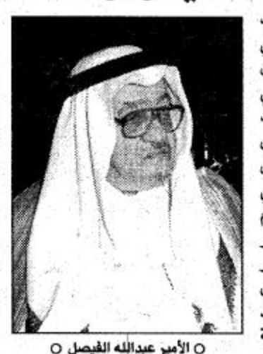
الأمير عبدالله الفيصل

بعد أن أمر سمو ولي العهد بإطلاق اسم عبدالله الفيصل على ملعب جدة الأمير سلطان بن فهد إطلاق الاسم الجديد تقديرًا لرائد الرياضة أمر صاحب السمو الملكي الأمير عبدالله بن عبدالعزيز ولي العهد ونائب رئيس مجلس الوزراء ورئيس الحرس الوطني بإطلاق اسم صاحب السمو الملكي الأمير عبدالله الفيصل على استاد الرياضة العامة لرعاية الشباب بمحافظة جدة ليصبح مسماه الجديد استاد الأمير عبدالله الفيصل بمحافظة جدة. أعلن ذلك صاحب السمو الملكي الأمير سلطان بن فهد بن عبدالعزيز الرئيس العام لرعاية الشباب