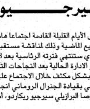
الأمير بندر بن محمد

يبحث اجتماع أعضاء شرف نادي الهلال خلال الأيام القليلة القادمة اجتماعاً هاماً وحاسماً تم التحضير له طوال الأسابيع الماضية وذلك مناقشة مستقبل النادي وفي مقدمتها مجلس الإدارة الذي ستنتهي فترته الرئاسية بعد 18 يوماً من الآن وهناك اتفاق على استمرار الإدارة الحالية بعد النجاحات التي حققتها هذا العام. كما سيتم التركيز بشكل مكثف خلال الاجتماع على مناقشة إمكانية استمرار الجهاز الفني بقيادة الجنرال الروماني يوردانيسكو والمحترفين الأجانب وخصوصاً البرازيلي سيرجيو ريكاردو، أما لينا فان مغابرة للهلال مؤكدة.