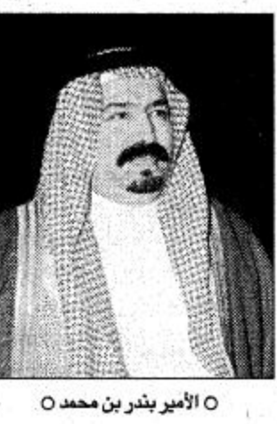
الأمير بندر بن محمد

تحققت وعن المستوى العام للمباراة قال سموه: «يا جماعة الخير» مباريات الكؤوس عامة ما تكون بتلك الصورة الفنية الخارقة للعادة بحكم حرص الفريقين على الخروج بالفوز. ولذا لم تكن مباراة الامس بذلك المستوى الذي كنا نتمناه حيث حرص من الطرفين على النتيجة.. وعن السوبر الآسيوي القادم قال: دعونا نفرح بكأس اليوم وبإذن الله تكون للهلال كلمة مشرفة في بطولة السوبر.