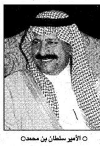
الأمير سلطان بن محمد

وهذا الكأس الغالي يحق للهلالين ان يقضوا اجازة سعيدة بتحقيقهم لربع بطولات في موسم واحد مليء بالمشاركات الكثيرة المتعبة ولكن لاعبو الهلال تمكنوا ببطولة غالية الكأس. وبهذا الكأس الغالي يحق للهلالين ان يقضوا اجازة سعيدة بتحقيقهم لربع بطولات في موسم واحد مليء بالمشاركات الكثيرة المتعبة ولكن لاعبو الهلال تمكنوا ببطولة غالية الكأس.