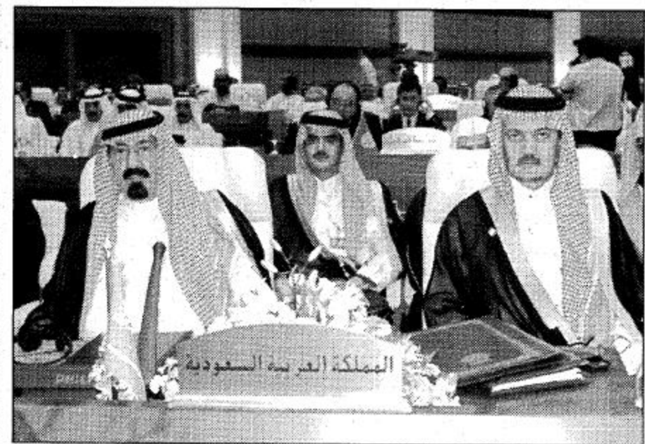
سمو ولي العهد لدى افتتاح أعمال مؤتمر القمة الإسلامي التاسع ○ واس