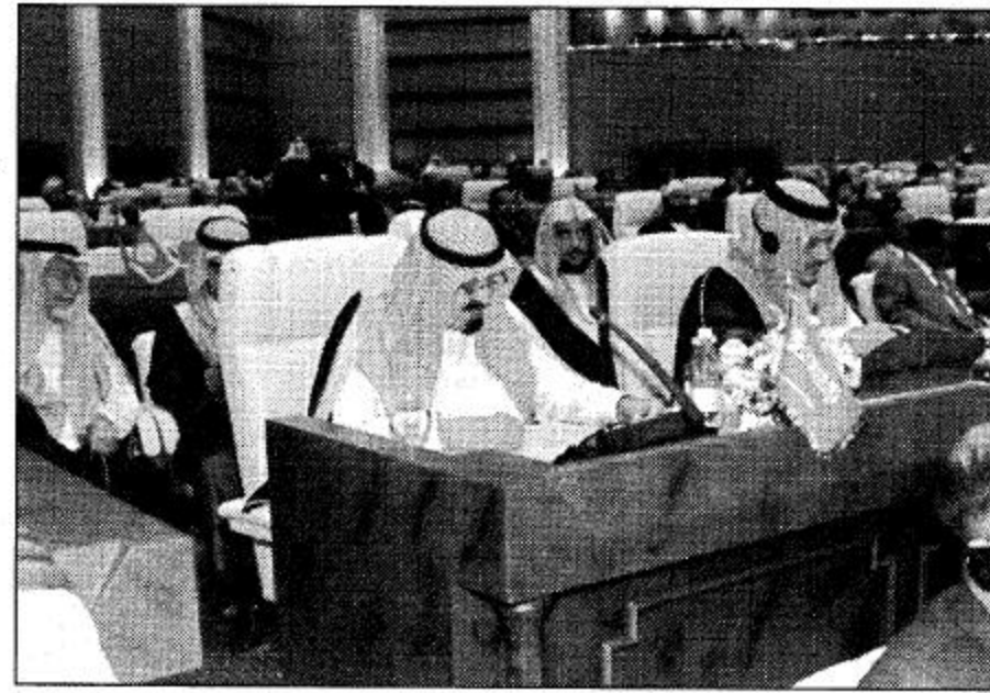
سمو ولي العهد يلقى كلمة الملكة في مؤتمر القمة الإسلامي