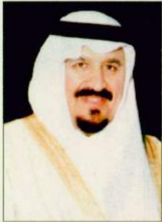
الأمير سلطان بن عبدالعزيز