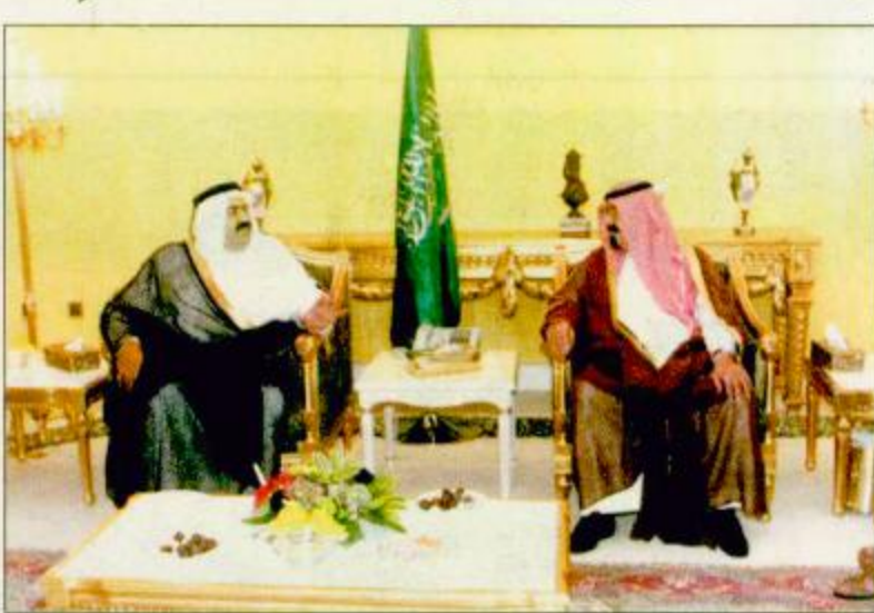
سمو ولي العهد يستقبل أمير دولة قطر

ويعقد سمو ولي العهد وفد يضم صاحب السمو الملكي الأمير سلطان بن عبدالعزيز أمير منطقة الرياض وأصحاب السمو الملكي الأمراء وأصحاب المعالي الوزراء وكبار المسؤولين من مدنيين وعسكريين وجمع من المواطنين. ويرافق سمو ولي العهد وفد يضم صاحب السمو الملكي الأمير سلطان بن عبدالعزيز أمير منطقة الرياض وأصحاب السمو الملكي الأمراء وأصحاب المعالي الوزراء وكبار المسؤولين من مدنيين وعسكريين وجمع من المواطنين.